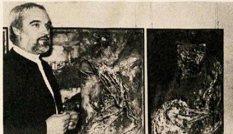
Razstava je odprta do 12. decembra 1980, in sicer dnevno od ponedeljka do petka od 13. do 17. ure.