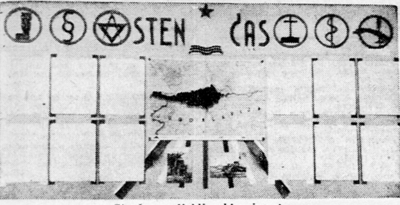
Stenčas na ljubljanski univerzi

Vsak dober stenčas je zrcalo tistih težej in stremljenj, ki so žive v podjetju, ustanovi ali skupnosti, ki svoj stenčas piše. Kaj čuti ljubljanska univerza ob reševanju vprašanja Slovenske Koroške? V sredini velikega stenčasa, ki je amehčen v avli univerze, je zemljevid Slovenije. Na tem zemljevidu je nazorno prikazano slovensko narodnostno ozemlje na Koroškem in začetna krivična meja iz leta 1920, ter označena razmejitvena črta, kakor jo je predlagala jugoslovanska vlada. Pod zemljevidom sta oljnat sliki vojvodske prestola in koroške slovenske pokrajine.