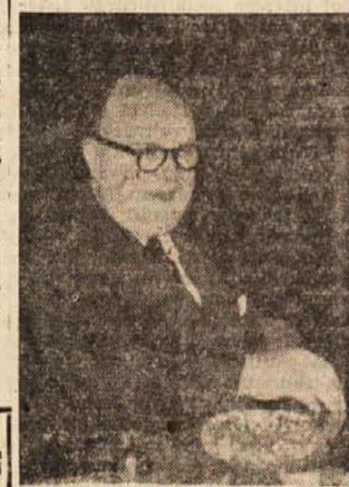
Paul Henri Spaak

Strasburg, 18. sept. (AFP). Posvetovalna skupščina evropskega sveta je na svoji večerajšnji seji podpisala poročilo Paul Henry Spaaka o evropski politiki v luči nedavnega razvoja mednarodnega položaja. Paul Henry Spaak sodi, da je zadnja sovjetska mirova ofenziva sprememba taktike spriče potrebe nagle obožitve in želje, da bi ustvarili razdor med zahodnimi državami.