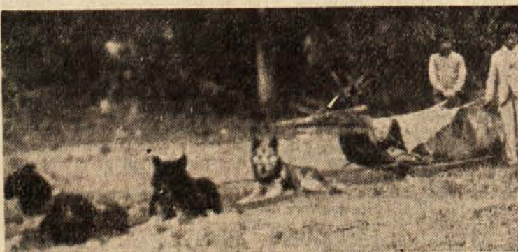
Otroka Slovenca Pianinška s pasjimi sanmi med Eskimi

Se pred nekaj leti takšne ladje ne bi mogli zgraditi. Le malo ljudi bo lahko videlo njene lepote. Nihče ne sme fotografirati njenega spodnjega dela. Nekoč je nek strokovni časnik po naključju dobil in objavil posnetek spodnjega dela, pa so takoj vso njegovo naklado uničili. Razen tega so »United States« gradili v suhem doku in ko so prišli prvi gostje k njenemu krstu, je polno opremo iz San Francisca v Azijo in se vrne, ne da bi med