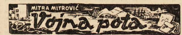
ILUSTRIRALA CUCA SOKIC

Zivela XV. SNOUB belokranjska! Zivela JLA in njen vrhovni komandant maršal Tito!