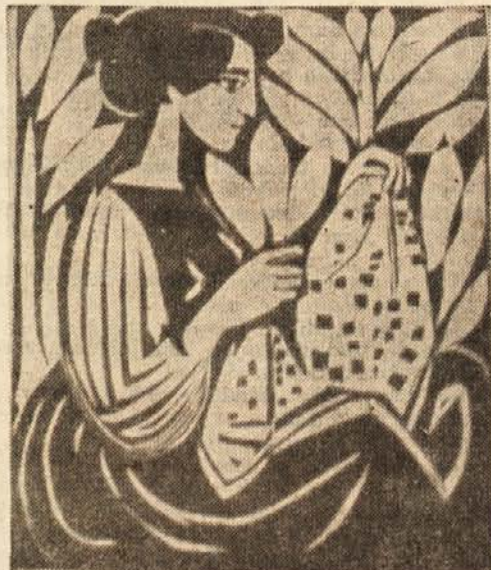
Frano Baće: Lesorez

Zandarjeva kri se je polagoma razvnela, začel je preklinjati in rohneti, njegov sosed pa ga je komaj poslušal. Miloja je spreletaval drget. Čutil je ostuden smrad po smrti, videl jo je pred seboj, mislil je na ženo in otroke.