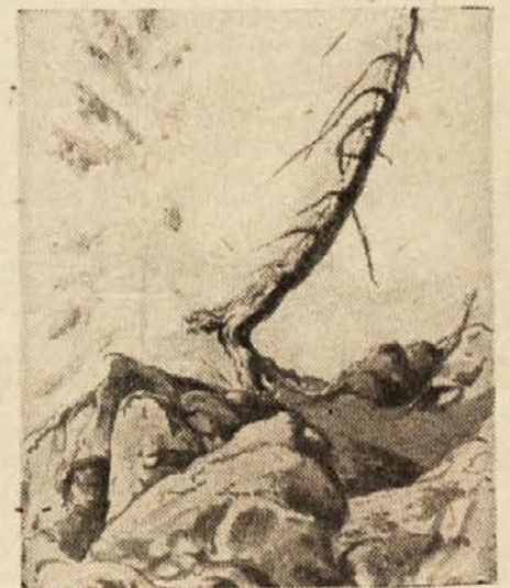
Božidar Jakac: Motiv z Roga