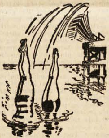
»Dragi gospod, Vaša snubitve je prišla tako nepričakovano!«