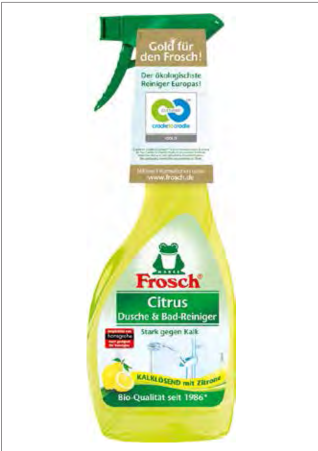
Slika 4 : Certificiran produkt WERNER & MERTZ Frosch GOLD [7]

v procesu načrtovanja je razvoj celovite konotacije kakovosti s pozitivno opredelitvijo sestavin. Izdelki morajo biti v prihodnosti zasnovani tako, da so uporabni za materialne cikle. Potrebno je izboljšati kakovost recikliranih postopkov tako, da je možno recikliranje na enaki ali celo višji ravni.