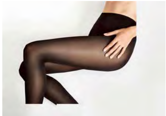
Slika 5 : Certificirana linija premium textila Wolford [9]

Avstrijsko tekstilno podjetje Wolford [8] z lokacijama Bregenz v Avstriji in Murska Sobota v Sloveniji odpira novo zgodbo v smeri krožnega gospodarstva. To je preboj na področju oblačil in tekstila.