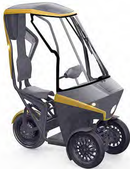
Slika 6 : BICAR [10]

BICAR je poimenovan »zlato oko« kot nov način oblikovanja in doživljanja vožnje na kratkih razdaljah.