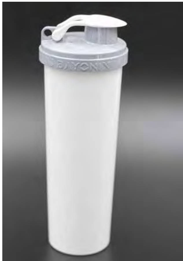
Slika 3 : Certificiran proizvod športne steklenice BAYONIX [6]

Inovativna steklenica BAYONIX predstavlja prvo športno steklenico, ki je prejela certifikat Cradle to Cradle Certified na »zlatem« nivoju. Je zelo lahka, v njej je tekočina v celoti (100 %) obdana z ma-