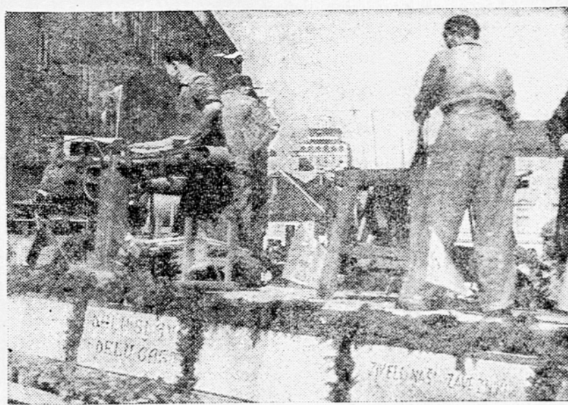
Trije izmed nešteti prizorov z nedeljskega velikega spreveda po Ljubljani. V sredini »mlin« gorenjskih mlinarjev s pomembnim napisom »Dober je kruh v Titovi Jugoslaviji!«