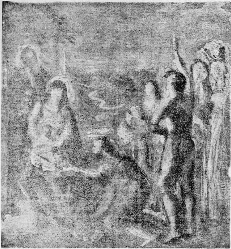
Margherita Bembina: Jaslice (tempera)

Z RAZSTAVE TRŽASKIH UMETNIKOV V LJUBLJANI