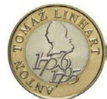
Kovanec za 500 slovenskih tolarjev