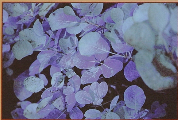
»JESEN NA SATURNU« (MATEJ SUSIČ, 2007).