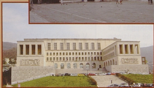
Koprska in tržaška (spodaj) univerza.