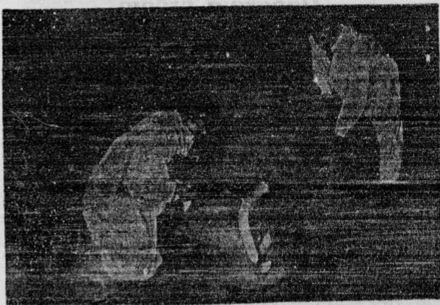
Na Dunaju so plombirali 3500 kg težkemu slonu zob. Precej priprav je bilo treba za to nenavadno operacijo.