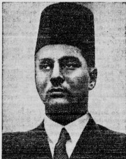
Mladi egiptovski kralj Faruk se je te dni poročil s hčerko svojega visokega uradnika in bogataša Varido. Zenit je star 18 let nevesta pa 16 let. Ob poroki so bile velike parade.