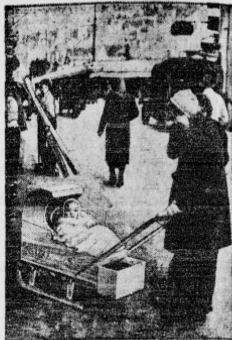
Tudi malim otrokom hočejo po zimskih letovišnih privoščiti malo zimskega veselja.