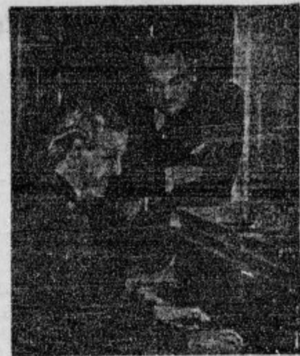
Dr. Stojadinovič, predsednik naše vlade s svoje soprogo v domači hiši.