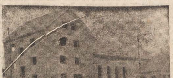
1. slika: Združni dom v Mokronogu so frontovci dogradili v surovem stanju že konec lanskega leta. Letos že zbirajo material, da bo dom čimprej gotov. Dostlej so zbrali 15 ton cementa, 50 m 3 peska in 776 m 3 stekla. Pri gradnji združnega doma so frontovci opravili do sedaj nad 29.000 prostovoljnih ur. Za ta veliki uspeh so lani dobili tudi prehodno zastavico Izvršnega odbora OF Slovenije.

Letos so frontne organizacije močno dvignile svojo aktivnost. Vsaka osnovna organizacija si je ob sodelovanju vsega članstva postavila plan in načrtno razporedila delo. Združni domovi in frontni kotički so središča, kjer množice frontovcev dvignejo idealoško znanje in razpravljajo o napredku svoje vasi. Prav zaradi temeljitega političnega dela so bili doseženi tudi veliki uspehi v prostovoljnih akcijah in razvoju združništva.