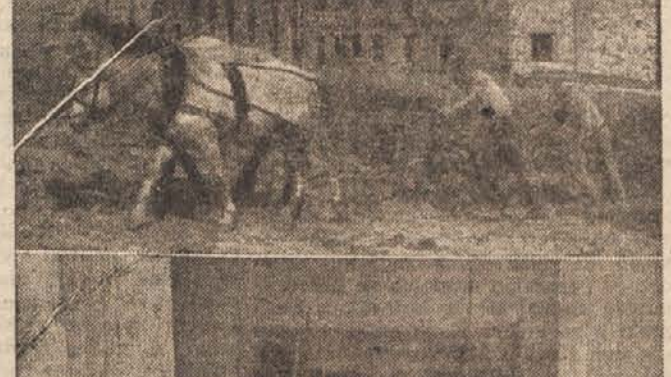
3. slika: V Tomaju hočejo čimbolj razviti kulturno-prosvetno delo. V novem združnem domu urejajo frontovci oder in dvorano, kjer se bodo redno zbirali h kulturno-prosvetnim prireditvam in na množične sestanke.