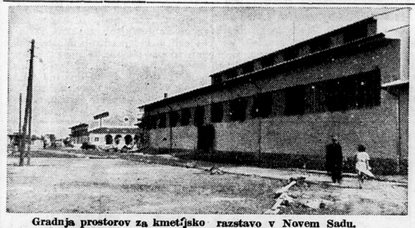
Gradnja prostorov za kmetijsko razstavo v Novem Sadu.

Na gradbišču prvega bosansko-hercegoveškega metalurgičnega kombinata so bile proglašene nove udarne brigade. Za prekoračenje delovnih nalog in zaradi uspehov na drugih področjih dela je bilo 8 brigad proglašanih za udarne, dve sta bili pohvaljeni, srebreniška mladinska brigada pa je dobila prehodno zastavico. Rasinska mladinska brigada je sedaj že petič proglašena za udarno.