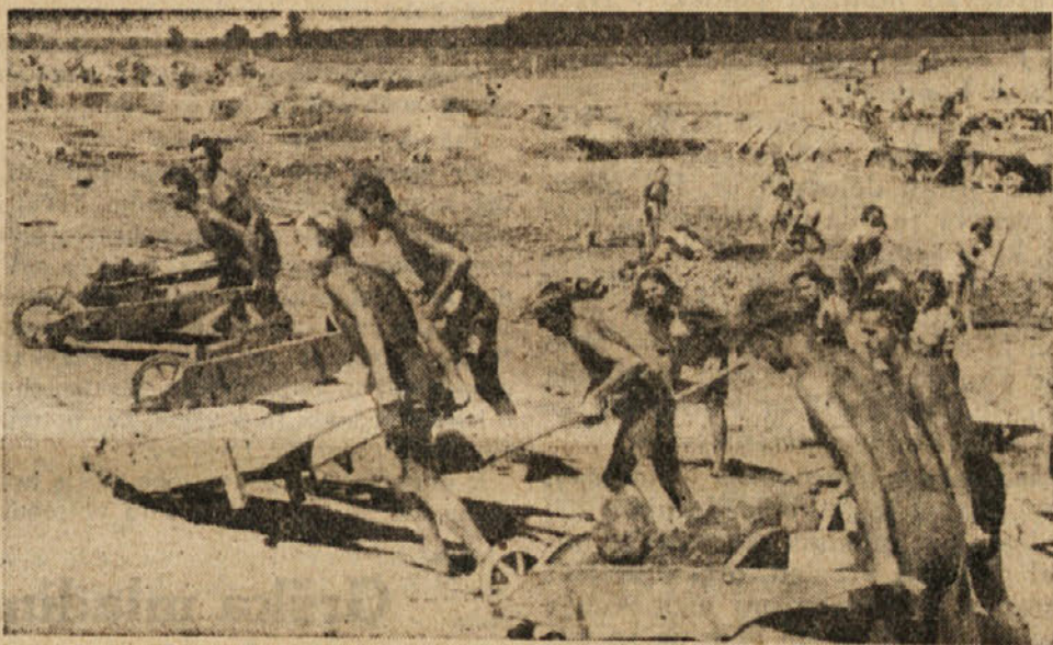
Mladinske brigade na delu

teden. Proslavili ga bomo najbolje na ta način, da bomo v celoti izpolnili tekmovalne obveze in jih tudi prekoračili.