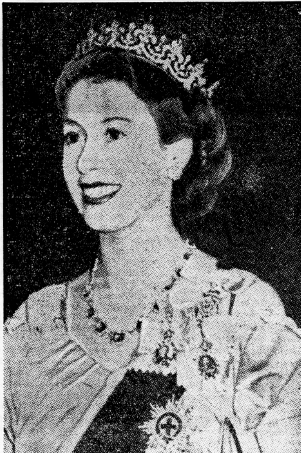
radijska družba bo prenašala poročilo o kronanju v 42 jezikih. S posebnimi letali bodo prenašali slike s kronanja v Ameriko, kjer jih bodo televizijske družbe predvajale že nekaj ur pozneje.

Tanger, 1. jun. Eden od tangerških listov v arabskem jeziku je danes izrazil mišljenje, da se za nedavnim protestom maroških paš in kadjev proti maroškem sultanu morda skriva francoski generalni rezident Guillaume,