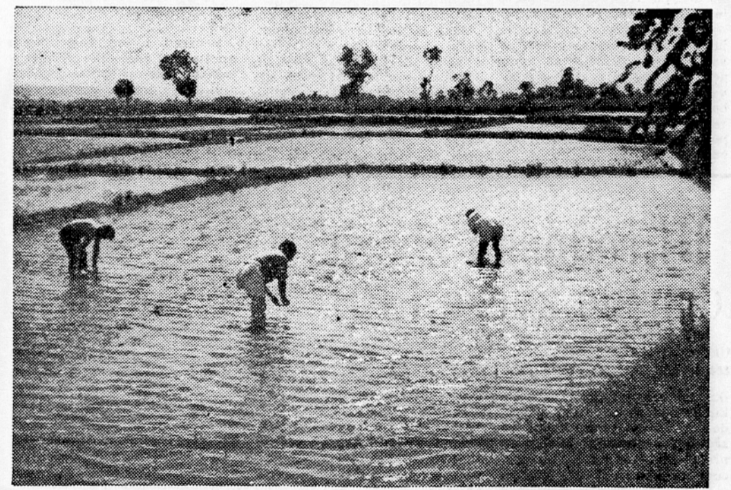
Medtem, ko pričakujejo v Vojvodini, da bo znašal pridelek pšenice približno 2000 kg na ha, jetmena pa okoli 3000 kg, se tudi v Makedoniji nadejajo letos zelo dobre letine in visokih pridelkov. V dolini reke Vardarja se bo približno danje pričela žetev, ki je tukaj izredno zgodnja spričo blagodejni vplivov Sredozemskega morja. - Na sliki vidimo plantažne nasade riža pri Kočanu v vzhodni Makedoniji

V Varaždinu so v počastitev rojstnega dneva maršala Tita začeli graditi novo tovarno upognjenih lesnih izdelkov »Florijan Bobič«.