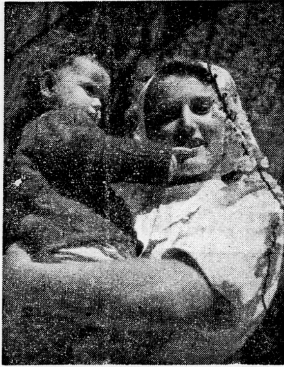
ženski pevski zbor iz Ljutomer. Dijaki nižje gimnazije v Ljutomeru bodo obiskali mladinski dom v Verzeju, kjer bodo uprli.

V vinogradničnem predelu Ljutomerskega okraja je alkoholizem vedno socialno vprašanje, ki povzroča ogromno škodo zdravju prebivalstva, življenjski ravni in zlasti družinsko življenju ter vzgoji otrok. V Teden matere in otroka bodo imeli poleg drugih po vsem okraju tudi predavanja o posledicah pijančevanja. Kako pereče vprašanje je alkoholizem ne samo v vinskih okrajih in po kmečkih domovih, temveč celo v vinogradniških zadrukah, dokazuje to, da so v Železnih dvirih nameravali zapreti otroški vrtec in namesto njega odpreti gostilno. K temu jih gotovo ni vodila samo želja po dobičku, temveč tudi želja nekaterih družnikov po pijači, ki bi bila tako slobodni pri roki, kakor je sedaj.