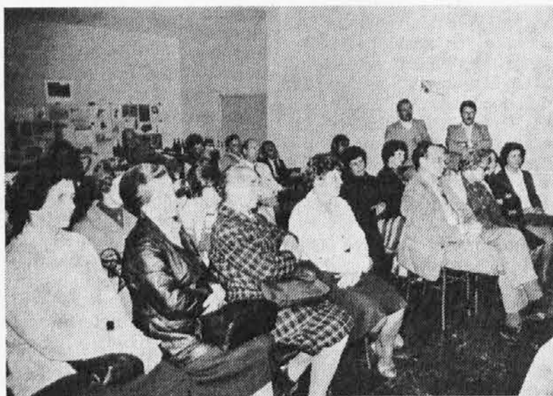
Kmečke žene Zadružne zveze Slovenije na srečanju z zadružniki v Ažli

La riunione ha rappresentato a Jovič la situazione della Slavia Veneta dopo il terremoto, il bilancio degli aiuti ricevuti e le indicazioni per la futura collaborazione per la ricostruzione.