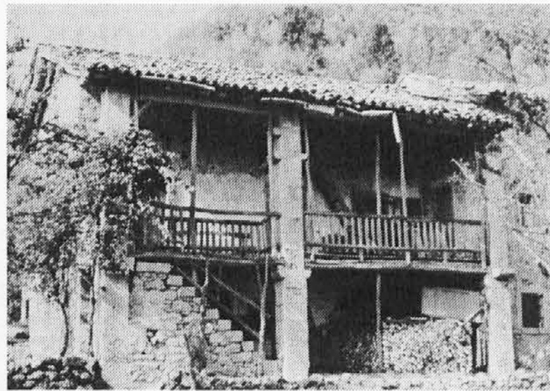
Tipična beneška hiša v Platiščah