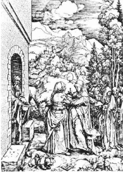
Dürer, Marienleben , Holzschnitt. Urn 1504/05

narisal risbo oz. predlogo, vrezal najbolj kritične dele tiskovne forme sam, ostalo pa prepustil pomočnikom, ki so lesorez tudi odtisnili kot samostojno sliko ali kot ilustracijo v knjigi. Znani so primeri kopiranja lesorezov, ki se pojavljajo kot ponatisi (Slika 1) tudi v drugih tiskarskih tehnikah, npr. kot bakrorez že v 15. stoletju. Uporaba tehnike lesoreza za faksimiliranje iz literature ni znana.