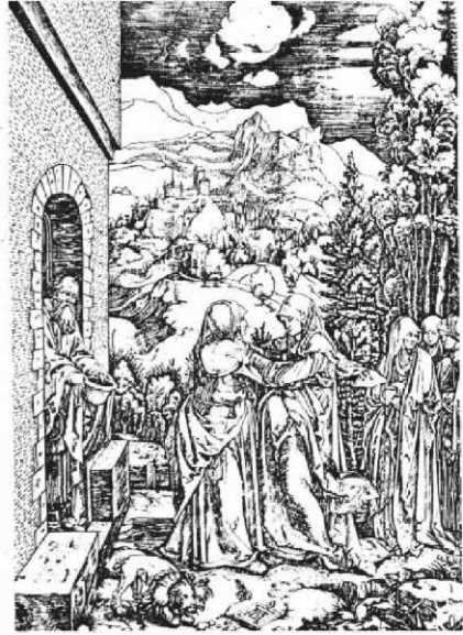
Kopie in Kupferstich von Raimondi. Um 1507

Slika 1: Originalni Dürerjev lesorez Marienleben iz leta 1504/05 in Raimondijeva kopija v barorezu iz leta 1507 (Mayer, 1984).