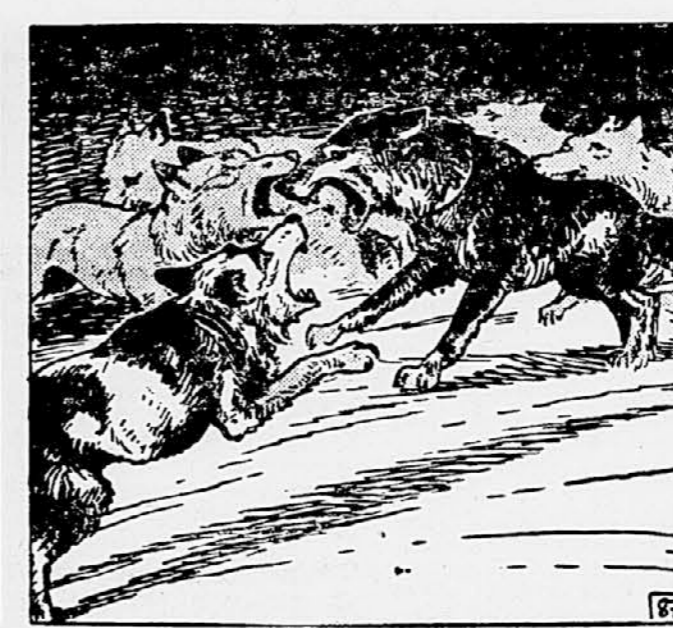
87 Dve zaporedni kroglj sta podrlj najbližja volkova Kazanu pa je prestregla pot nova ovira. Mož je bil izklopel pse, ki so se sedaj pognali proti napadajočim volkom. Z divjim srdom in dvakratno močjo se je Kazan spoprijel s njimi, ob njegovi rami pa se je borila tudi Siva. Možu je pošlo strelivo in volkovi so se približali sanem.