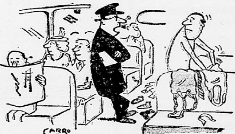
»Ali ne bi bilo hitreje, če bi kupili nov listek za 10 dinarjev?«

Ljudi. Puljsko areno so zgradili pred 1900 leti. Gradil jo je baje Trajan, ki je zasnoval veliko monumentalnih stavb. Arena je v resnici samo notranja elipsa amfiteatra, ograjen prostor, v katerem so se gladiatorji borili med seboj in proti divjim zverem. Publika je bila ločena od arene s kamnitim zidom in zeleno ograjo, ki je varovala gledalce obenem pa zapirala gladiatorjem pobeg pred razbesnelimi zvermi. Puljska arena ima tri nadstropja, nekdanj je bila vsa impozantna stavba pokrita s plateno streho, ki je varovala obiskovalce pred dežjem in soncem. Amfiteater je visok 24 metrov, vsako nad-