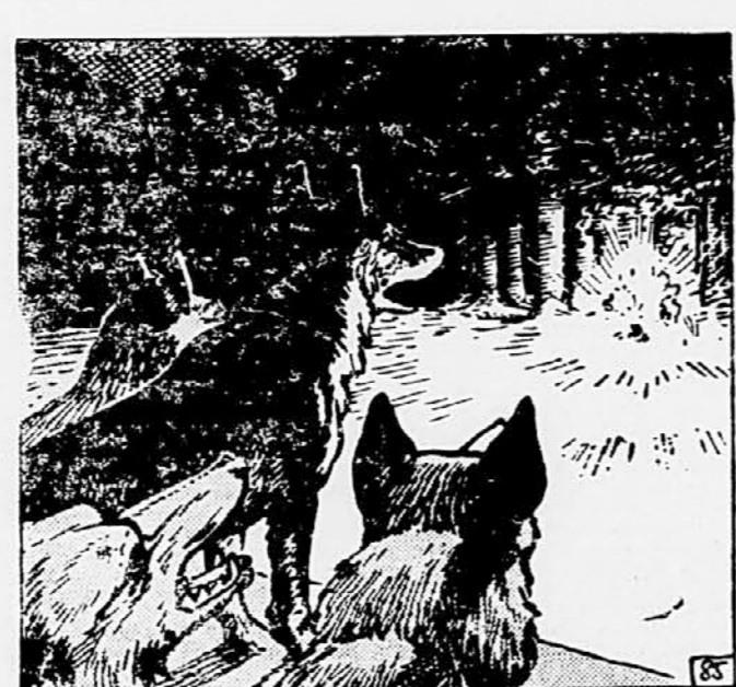
85 Za Kazana pa je prišla ara maščevanja! Poplačar je hotel vse krivice, ki so mu jih prizadeli ljudje, in dvakrat poplačati belčino, ki so jo prizadeli Sivi. Z nje strani je popeljal volkove po svežih sledih. Približali so se gozdičku Kazan je previdno zaustavil krdelo, potem pa se je v glasnim lajanjem pognal v napad.