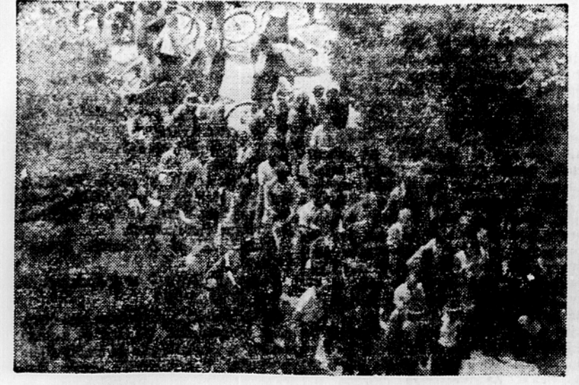
Pred zvočniki pred sodno palačo poslušajo številno občinstvo potek razprave

Sirc: Stvari, ki so se mi zdele take, da bi sploh prišle v poštev.