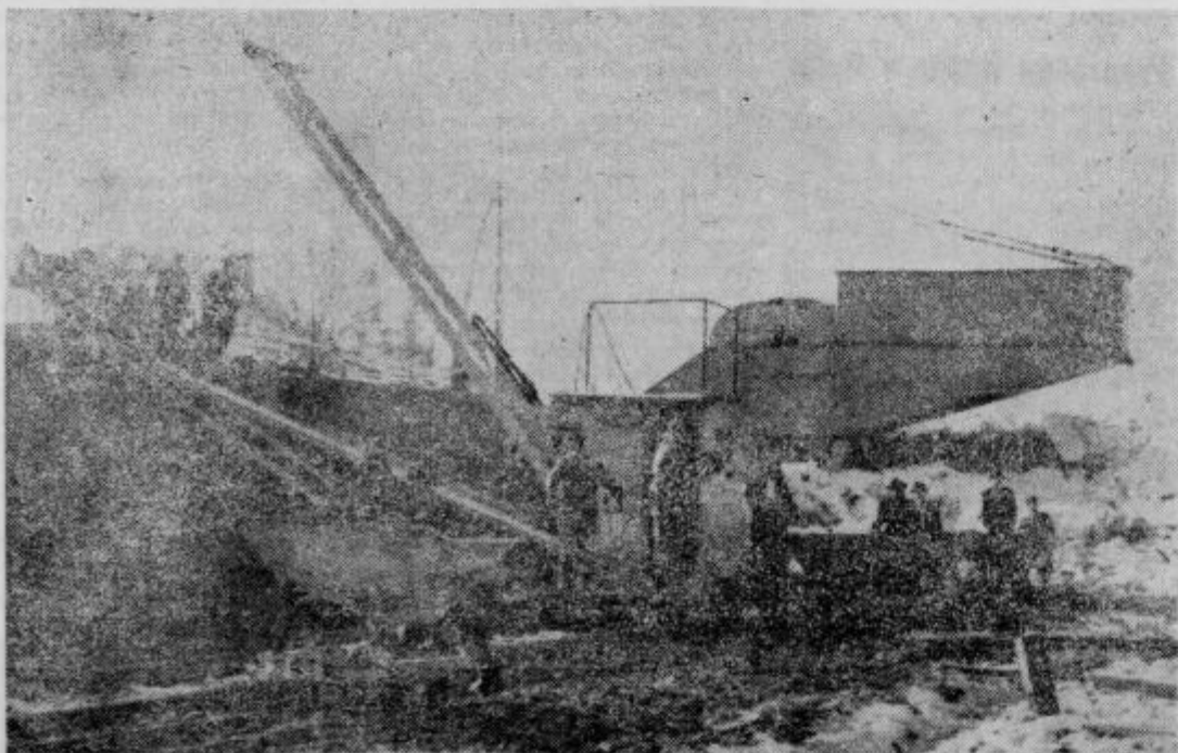
Nov bager Opekurne Zabajak bo pospešil proizvodnjo

Nekaj podjetij v Zagrebu je že v preteklem letu preizkusilo ta način nagrajevanja svojih delavcev in doseglo pri tem najlepše uspehe. Zato ni dvoma, da bo ta način tudi v vseh ostalih podjetjih rodil najboljše sadove in da bo po njem proizvodnja močno narasla.