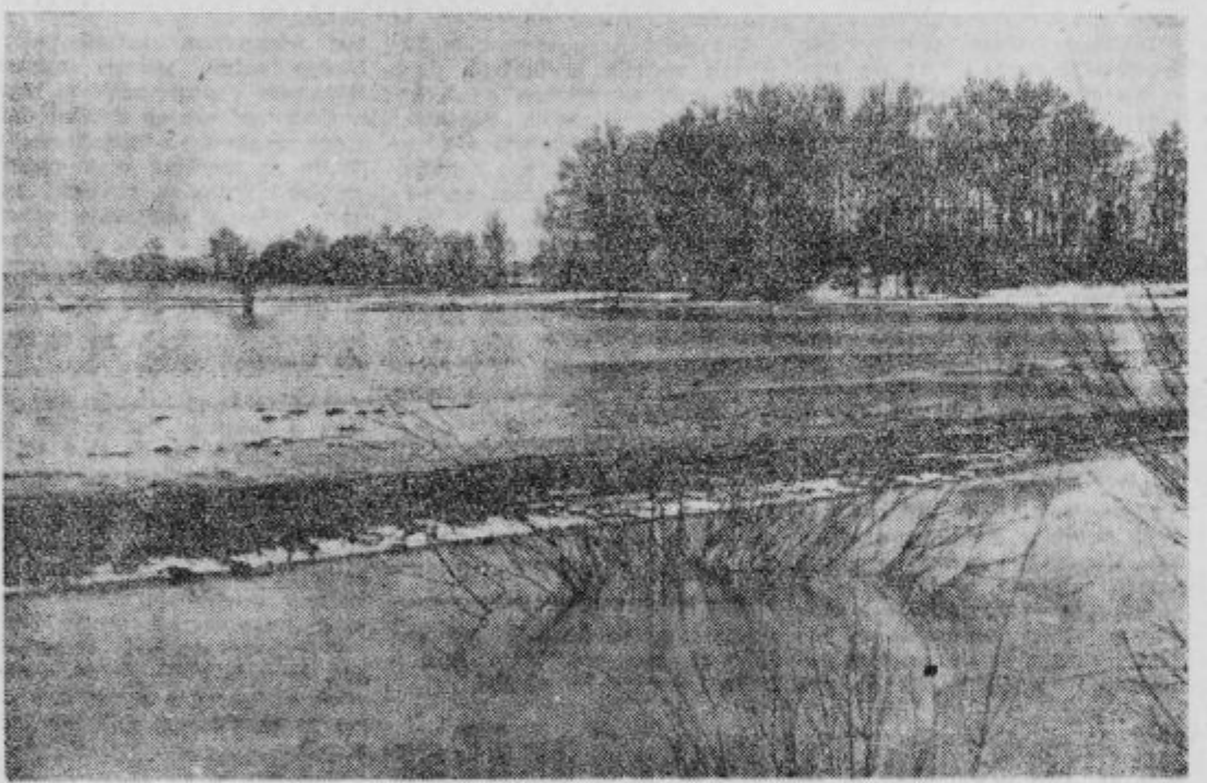
Dolina Pesnice — največje melioracijsko področje Slovenije

Na seji delavskega sveta znatno povečanega Trgovskega podjetja »ZBIRA« v Ptujju, 17. jan. t. l., so obravnavali med drugim vprašanje, kako bi prišel Ptuj