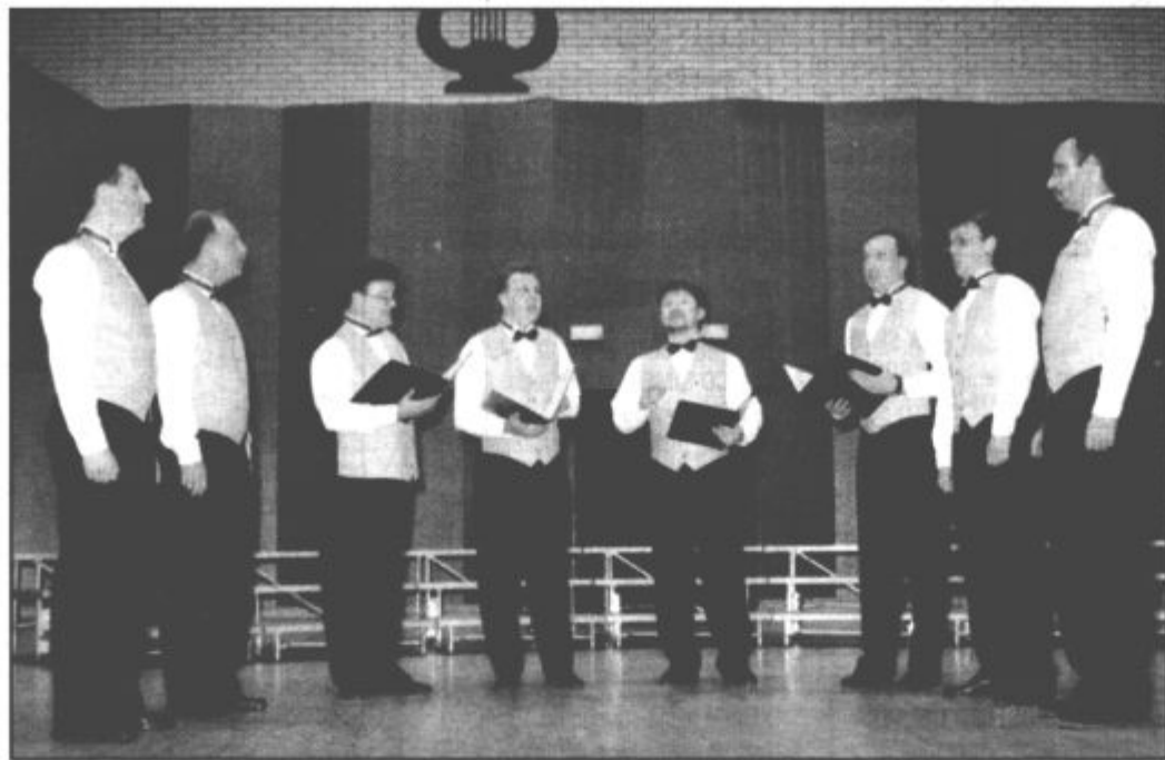
Člane okteta Teš čakata v bližnji prihodnosti še dva nastopa.