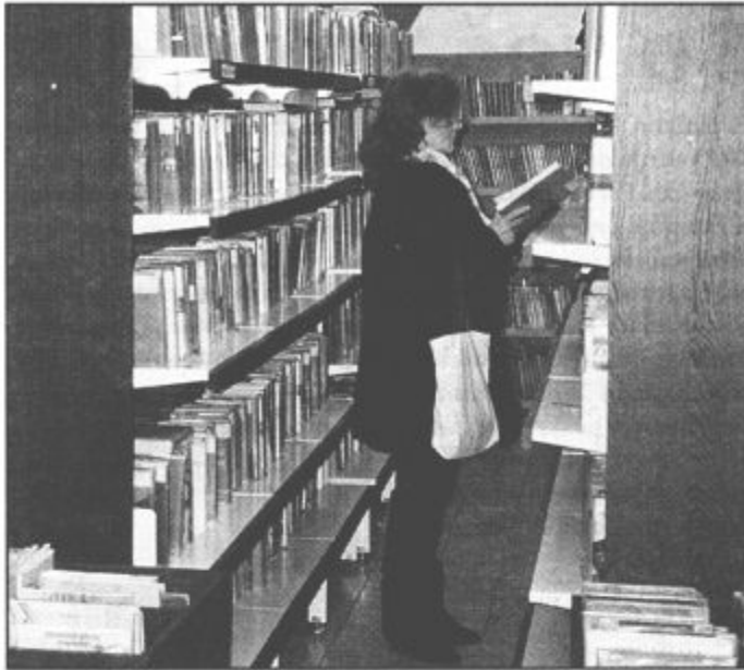
Bralci bi radi, da bi bila knjižnica odprta dvakrat in ne le enkrat na teden.

šmarškem oddelku knjižnice vpisanih 436 bralcev, dokaj redno jih zahaja vanj 321. Lani se jih je na novo vpisalo 25, med njimi je bilo največ srednješolcev. 2500 obiskov so zabeležili