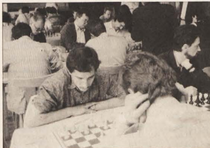
Tokrat bo v Celovcu potekal šahovski mladinski festival.

Pa še obvestilo: od 21. do 23. oktobra bo v Portorožu (Ljudski dom) medconski šahovski turnir FIDE. Udeležili se ga bodo tudi koroški šahisti.