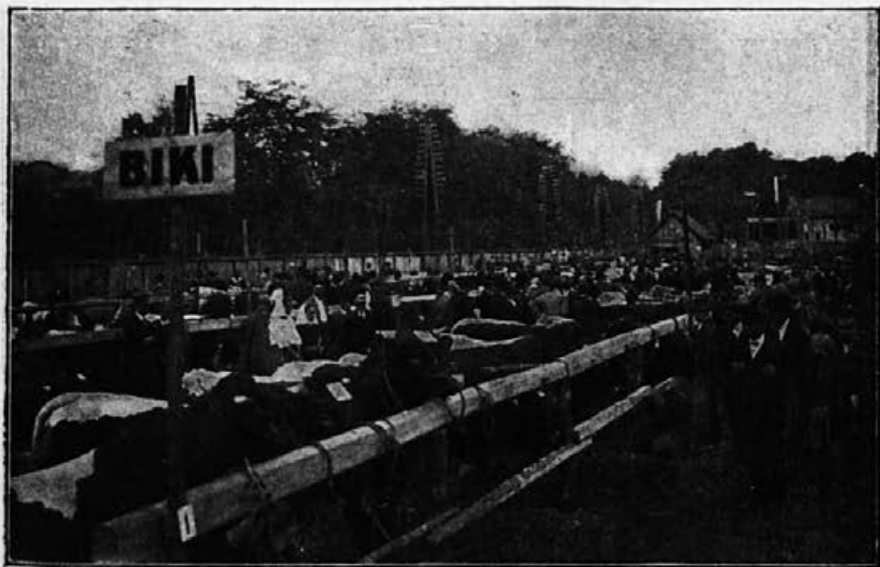
Premovanje bikov na lanski kmetijski razstavi.

Radi svoje ugodne gospodarske in prometne lege ter vsled naravne razumnosti in samozavesti slovenskega naroda, stopa Ljubljana letos osmič na plan, da v še večjem obsegu, prezirajoč vse ovire in težkoče, reprezentira mednarodnemu in našemu trgovskemu svetu napredek slovenskega in državnega gospodarstva.