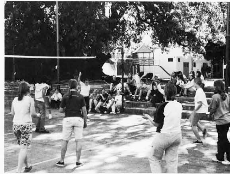
Med igranjem odbojke