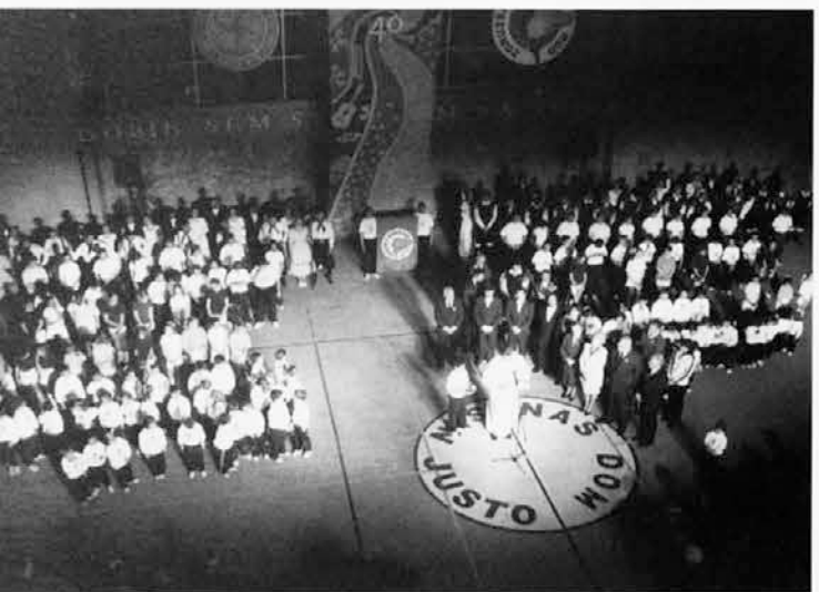
45. obletnica Našega doma, 40 let mladinskih organizacij ter blagoslovitev novega pokritega dvorišča ob obisku škofa Alojza Urana.