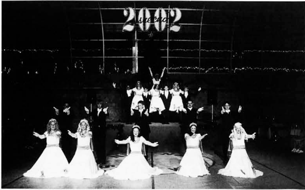
Plesni nastop mladine na Silvestrovanju v Našem domu