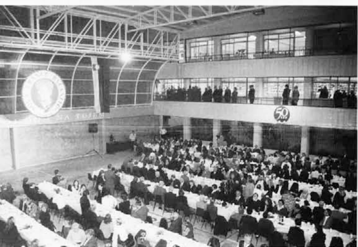
Blagoslovitev novih šolskih prostorov in slavnostna večerja ob petdeset letnici Balantičeve šole v San Justo.

Približala se je polnoč, čarobne sekunde, v katerih se prelija staro leto v novega. Trenutki upanja, pričakovanja, veselja, čustvenosti ter dobrih želja. Predsednica Našega doma nas je pozdravila in se zahvalila za vse delo in pridno sodelovanje skozi preteklo leto.