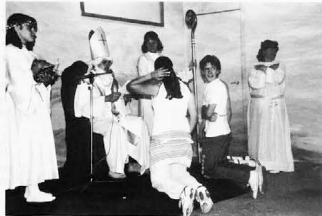
Sv. Miklavž je tudi presenetil naše mladce in mladenke