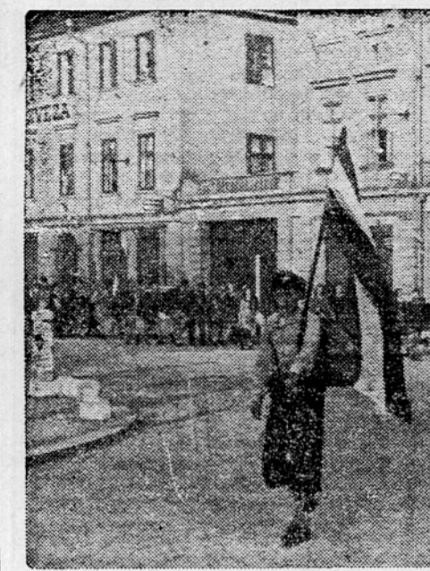
Naš mladinci in mladinke odhajajo v spredu na gl. kolodvor, da se odpeljejo na delo na Krško polje

Včeraj zjutraj je zdrnil Ljubljancane iz spanja velik živžav. Ze pred peto uro so se na ulicah pojavile skupine udarnikov, namenjenih na Krško polje.