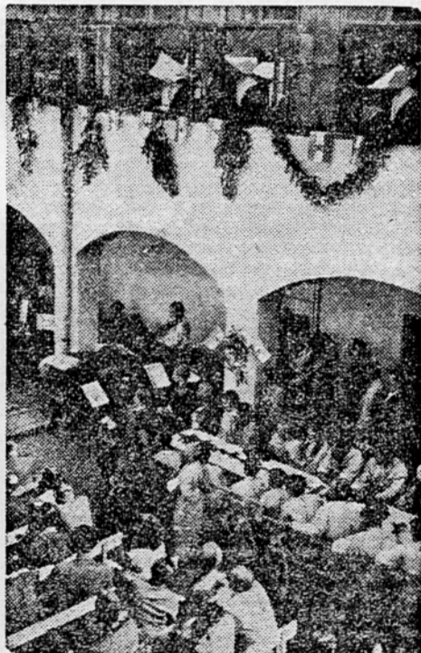
Miting, ki ga je priredila mariborska mladina našim ranjenim v mariborski bolnišnici

V njem prinaša za zdaj predvsem poročila, s čimer je razbremenjen naš dnevni tisk.