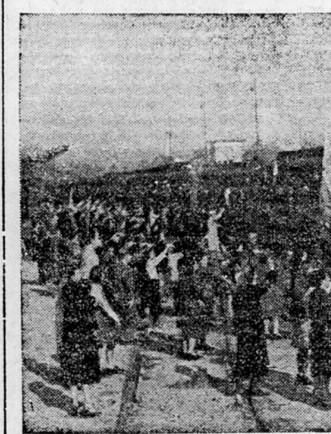
Slovo naše mladine od Ljubljane