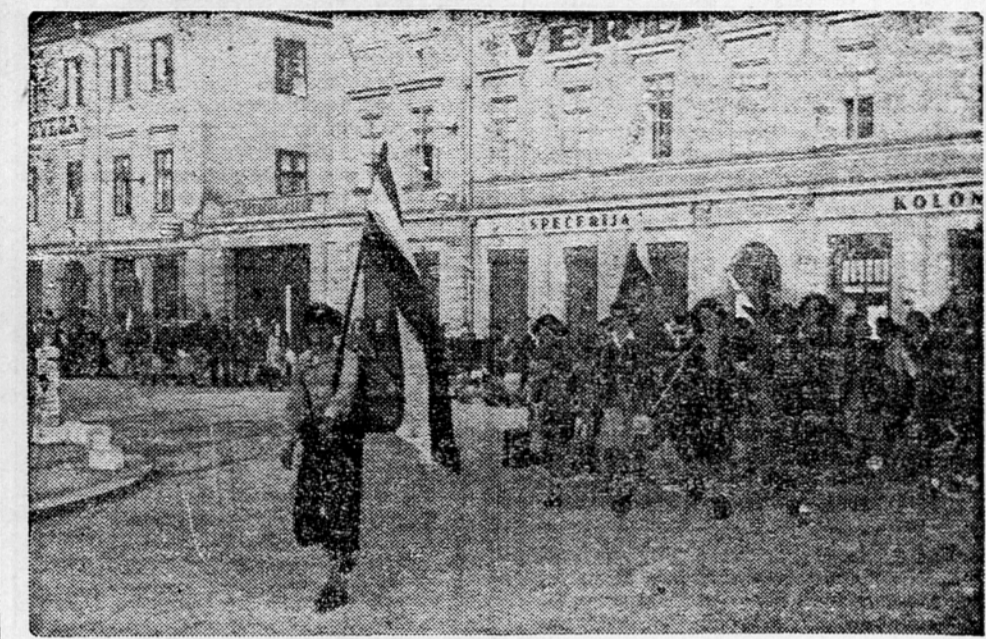
Naš mladinci in mladinke odhajajo v spredu na gl. kolodvor, da se odpeljejo na delo na Krško polje

mladina srca plesa in urejevala na terenu, objavljala pa ga bo v Ljubljani, kar bo posebno privlačno za svoje, ki so ostali doma.