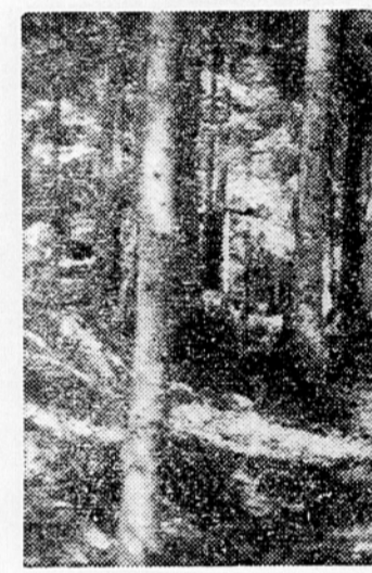
Barake na bazi T20 v Kočevskem Rogu

Društvo je uredilo v Kočevju upravnico, ki oskrbuje prebivalce in tudi okolico Kočevja s cvetjem, lepotičnim drevmem itd., a ki bo dajalo pobudo za ureditev prepotrebni parkov