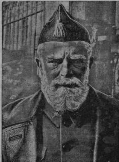
Cabanellas, 66 letni nacionalistični španski general, je umrl v Malagi. Cabanellas je bil predsednik obrambnega odbora Francovega vrhovnega poveljstva.

Sv. Anton v Slov. goricah. V soboto, 14. maja, po dveh popoldne nam je otožni glas zvona naznanil, da nekje gor! Kmalu je bila vsa vas na nogah in čuli so se obupni klici: »Na Cenkovi gor!« Črn, gost dim se je kmalu umaknil žarečim plamenom, ki so lizali izsušene slamnate strehe. V desetih minutah so stali pred nami samo še goli zidovi in goreče tramovje. To je ona pereča točka podeželja: slamnate strehe in pomanjkanje vode v naših krajih. Saj so prišli na pomoč gasilci iz Sv. Lenarta in Sv. Trojice, a morali so se vrniti, ker je zmanjkalo vode. Do-