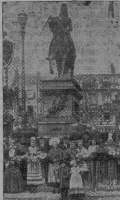
V francoskem mestu Orleans so proslavljali v zadnjem času narodno junakinjo »devico Orleansko«.