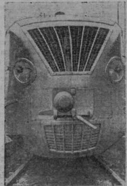
Motorni železniški voz, ki vozi z brzino 195 km na uro. V vagonu je sto sedežev za popotnike.

Takih in sličnih dogodivščin bi se dalo še več napisati. Gotovo pa je, da je trditev nekaterih vinogradnikov, da je inozemska galica boljše od domače, brez vsake podlage. Tu prihaja v poštev samo rezultat uradne analize, koliko bakrenega sulfata vsebuje ta ali ona modra galica. In če vsebuje domača galica »Sonce« glasom uradne analize 99.62% čistote, potem je s tem dovolj povedano, da je galica »Sonce« enake kakovosti kakor inozemska galica.