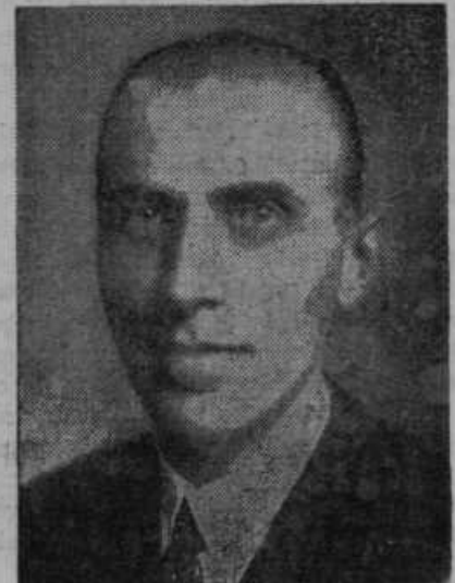
Imreedy, novi mažarski ministrski predsednik.