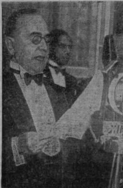
Brazilijanski predsednik Vargas je zatri v zadnjem času dva upora.