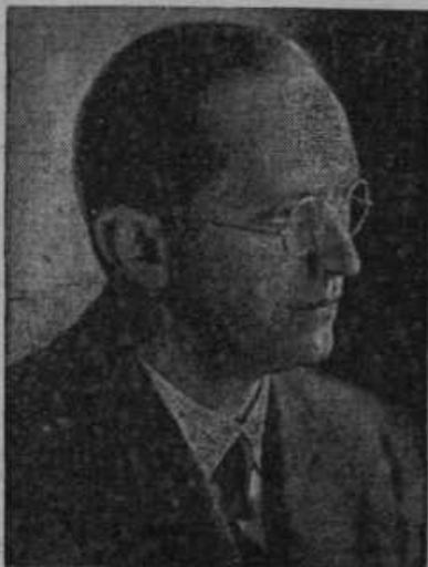
Henlein, vodja sudetskih Nemcev.

Sv. Ana v Slov. goricah. »V šoli se je moralo nekaj zgoditi.« Tak je naslov članka v »Domovnik« z dne 5. maja, v katerem se ponovno obrekuje začasni šolski upravitelj kot povzročitelj, da je krajevni šolski odbor prepovedal uporabo šolskih prostorov sokolskemu naraščanju, da je tudi knjigi sovražen itd. Resnici na ljubo, da se ne bo delala drugim krivica ter gotovi ljudje zavijali oči, izjavijam o tej zadevi naslednje: Kot predsednik krajevnega šolskega odbora sem prepovedal šolskemu naraščanju uporabo šolskih prostorov iz tehtnih razlogov. Vaje sokolskega naraščanja so se vršile brez potrebnega nadzorstva. Tako se je dogodilo, da so se pobile šipe, kvarile in raznašale šolske stvari itd. Zgodilo se je, da je neka mati ob 23 šia po svojega sinčka, ki je bil pri telovadbi. Ker pa so bili navzoči fantiči, stari okrog 14 let, in ni bilo nobenega nadzorstva pri tej telovadbi, so naraščajniki mater, ki je hotela, da gre njen sin z njo domov, potisnili skozi vrata, ista zaklenili, upihnilo luč in