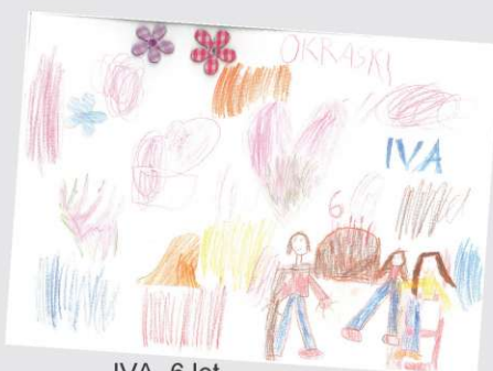
IVA, 6 let