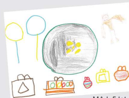
MAJ, 5 let