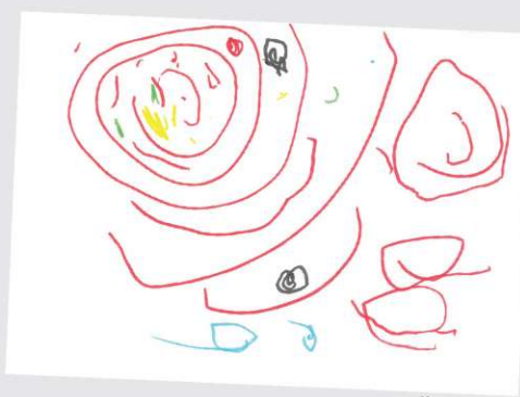
JOŠT, 2 leti