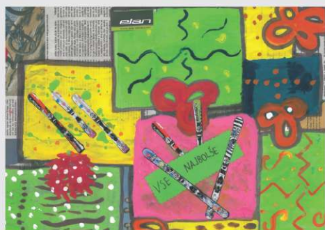
BOR, 8 let