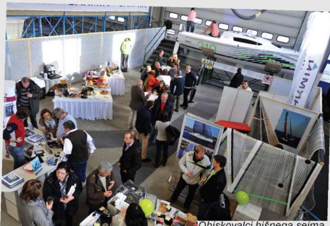
Obiskovalci hišnega sejma

Praznični december se je v Elanu začel s hišnim sejmom Elan Winter Show, kjer smo svojim poslovnim partnerjem in zainteresiranim kupcem pripravili predstavitev jadrnic. Predstavljena so bila plovila iz linije performance - Elan 210, nominiranka za evropsko plovilo leta 2012, Elan 350 evropsko plovilo leta 2011, Elan 310, Elan 450. Poleg teh so bile predstavljene tudi jadrnice iz crusing linije; novinka Impression 394 in kupcem že poznana Impression 444. Poleg plovil so se predstavili tudi dobavitelji navtične opreme. Obiskovalci so si lahko ogledali proizvodnjo plovil in smuči. Preko celoga vikenda, sejem je namreč potekal od petka do nedelje, je Elan Winter Show obiskalo več kot 350 navtičnih navdušencev. Za naslednje leto pa obljublamo, da bo Elan Winter Show še bolj zanimiv in vreden ogleda.