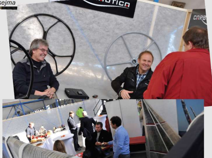
Obiskovalci hišnega sejma