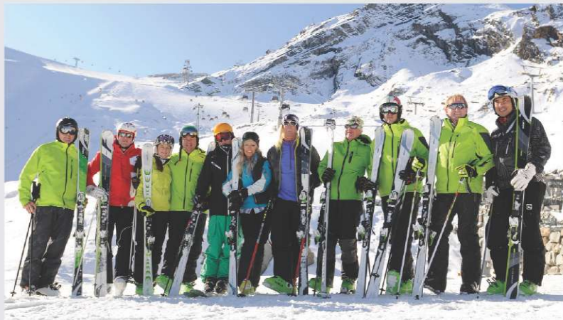
Elan Innovation Days