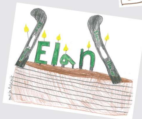
MATIJA, 9 let