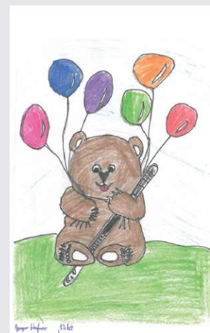
GREGOR, 13 let

Mesec januar bo v Elanu "mesec inovacij"! Ob tej priložnosti bodo nagrajeni vsi predlogi, tudi tisti, ki jih iz različnih razlogov ne bo mogoče realizirati. Več o prijavi predlogov in podrobnejših pravilih boste izvedeli preko intraneta in oglasnih desk.