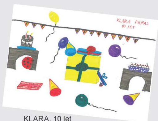
KLARA, 10 let