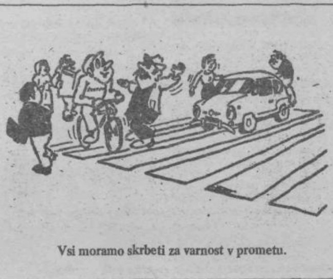
Vsi moramo skrbeti za varnost v prometu.

Šole v naravi se ne bodo udeležili učenci, katerim tako bivanje odsvetuje zdravnik in pa nekateri učenci, katerih starši odklanjajo tak način vzgoje in izobraževanja, ne zavedajoč se, da imajo šole v naravi poleg učenja smučanja veliko drugih vzgojnih in družbenih kvalitet za katere z odklonitvijo udeležbe prikrajšajo svoje otroke. Bogomir Sušič