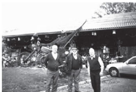
Upokojenci na izletu na Madžarskem in avstrijskem Štajerskem jeseni 2008

Leto gre h koncu. Marsikaj smo naredili, doživeli lepega in uspešnega pa tudi grenkega. Zelo zadovoljen lahko napišem, da je program Društva upokojencev Vitomarci uspešno izveden, posebno na področju izletov, srečanj in romanj. Poleg standardnih romanj smo si letos ogledali Linhartov in čebelarški muzej v Radovljici. Naslednji ogled je bil namenjen naselju - muzeju na prostem v Rogatcu. Bili smo na srečanju v Moškanjcih. Prostovoljci iz projekta za starejše so obiskali to-