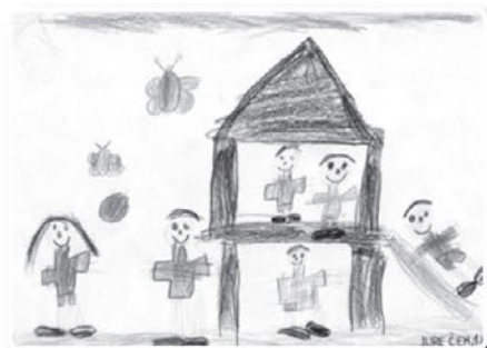
Jure Čeh 1.b