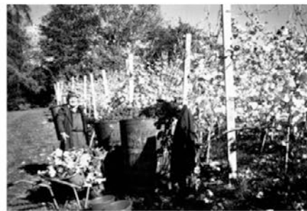
Pozna trgatav 2008 Dišečega traminca pri Kupčič Ediju. Dosežena stopnja vrhunske trgatve je izbor s 111 ekseljevih stopinj.

nastopili s svojimi medvedki. Žal so imeli mnogo previsoko intonacijo, zato smo lahko poslušali le sopran vzgojiteljice. V notnem zapisu je zagotovo tem otrokom primerna tonaliteta. Mnogo hujše tone in gibe pa so malčki izbrali po svojem nastopu, ne prvič. Motili so vso prireditvev. Malčki pač ne spadajo na take in tako dolge prireditve. Ali jih ne bi mogli odpeljati v njihovo igralnico, ker jih starši ne morejo krotiti?