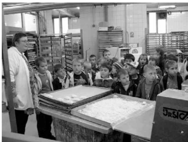
Učna ura peke