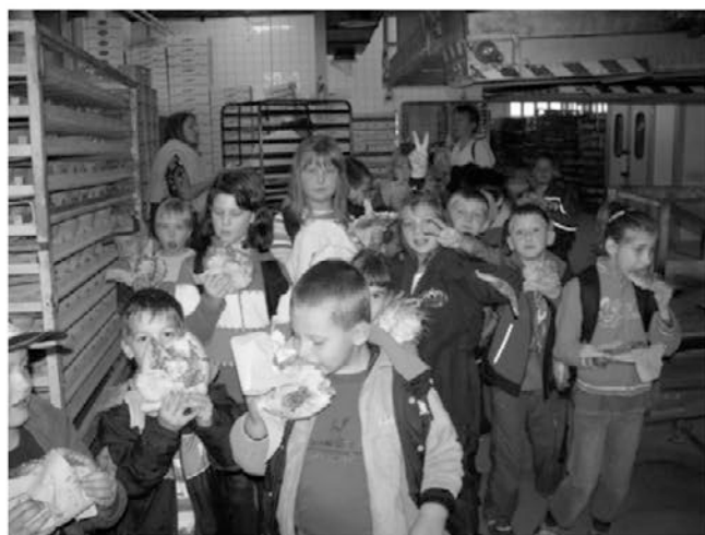
Mmmmmm, kako je dobra