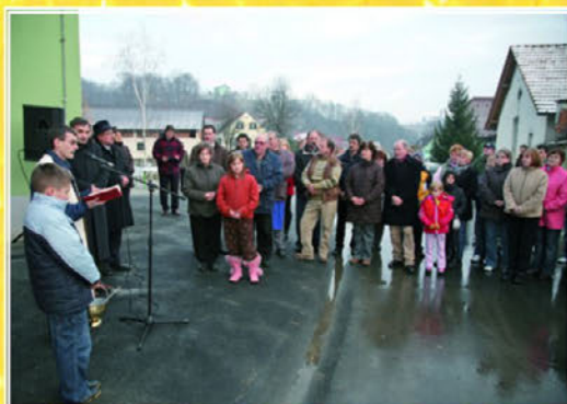
Da bi novozgrajena cesta služila namenu in predstavljala varno izbiro za doseganje vsakodnevnih ciljev, je z blagoslovom poskrbel domači župnik.