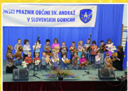
Otroci iz skupine Zmajčki v vrtcu Vitomarci so se predstavili s plesno točko Medvedek pleše. Na nastop so jih pripravile vzgojiteljice.