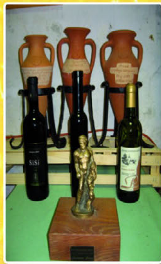
Razstava prikazuje uspeh vinogradniško sadjarskega društva v zadnjih osmih letih in petletnega dela v vinski turistični cesti VTC-13