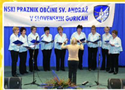
Članice ženskega pevskega zbora z vsakim letom zapoje bolj suvereno.