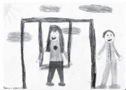
Špela Ljubec 2.b