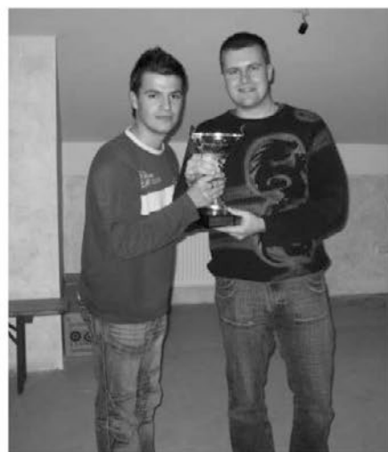
Pokal za zmagovalca v kartanju

Po končanem turnirju smo ob dobri glasbi tudi zaplesali.