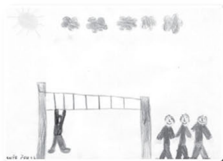
Anže Čeh 2.b