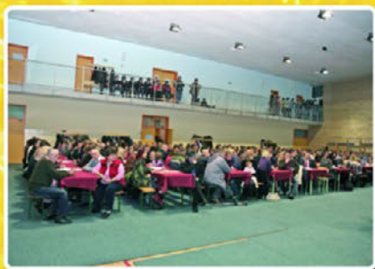
Dvorana je bila polna do zadnjega sedeža