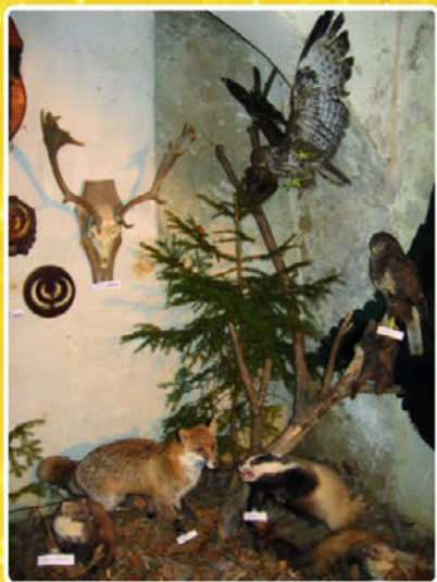
Na lovski razstavi so lovci razstavili lastne trofeje