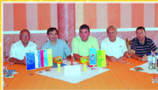
Podpis pogodbe s Cestnim podjetjem Ptuj 31. julija 2008