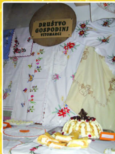
Gospodinje so razstavile razne dobrote s poudarkom na mlečno desertnih izdelkih in razstavile razne izdelke, ki so jih ročno izdelale