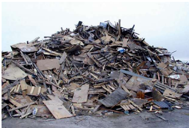
Slika 4: Odlagališče lesnih odpadkov (Lykidis in Grigoriou, 2008)

Pri odlaganju organskih odpadkov namreč prihaja do sproščanja emisij metana, ki ima 21-krat večji toplogredni potencial od ogljikovega dioksida (Lykidis in Grigoriou, 2008). Direktiva o odlagališčih (1999/31/EEC) zahteva zmanjšanje količine biorazgradljivih odpadkov v obdobju 20 let. V Veliki Britaniji so si kot cilj zastavili zmanjšanje lesnih odpadkov za 1/3 takratnega stanja. V EU velja strategija zmanjševanja lesnih odpadkov in je predstavljena s hierarhično lestvico: