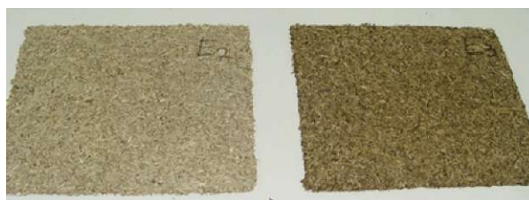
Slika 2: Barvna razlika med originalno (levo) in reciklirano (desno) iverno ploščo (Lykidis in Grigoriou, 2008)

Zaradi zapletenih metod in procesov pridobivanja recikliranega materiala iz LPK so Czarnecki in sodelavci (2005) uporabili material, ki so ga pridobili zgolj z mehansko obdelavo IP, zlepjenih z UF oziroma FF lepilom ter z mehansko obdelavo MDF plošč. Pridobljen material so uporabili