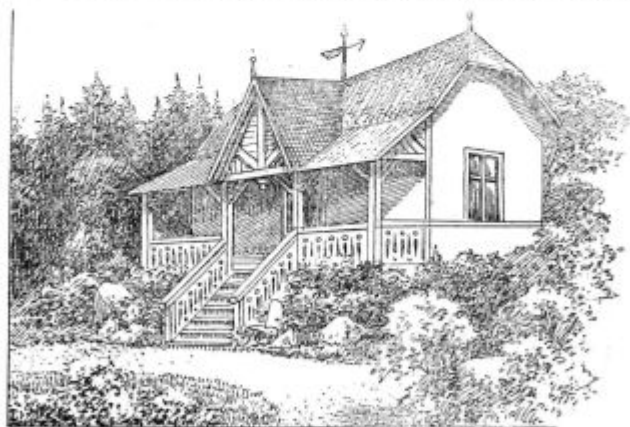
Pod. 23. Hiša obdana s cveticami. spredaj ima hiša lopo, spodaj klet.

Kdor ima dovolj prostora, postavi naj si blizu hiše tudi uto, katero obsadi s plezujočimi rastlinami ali pa tudi z vinsko