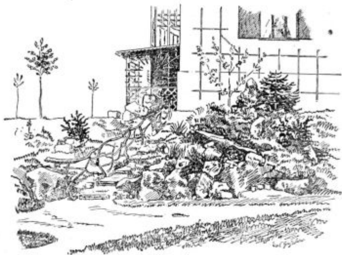
Pod. 22. Hiša z utico. Spredaj na levi st. pence z ograjo, na desni cvetlice med kamenjem. Ob hiši so pribite latve, ob katerih je razgrajena vrtnica.

Vse je pušto, vse mrtvo. Tu vlada čestokrat le nered in nesnaga. Ali bomo našli morda pri takem domovanju razvedrila? Na čem naj bi se veselili?! Morda na stari zamazani hiši? Ne!