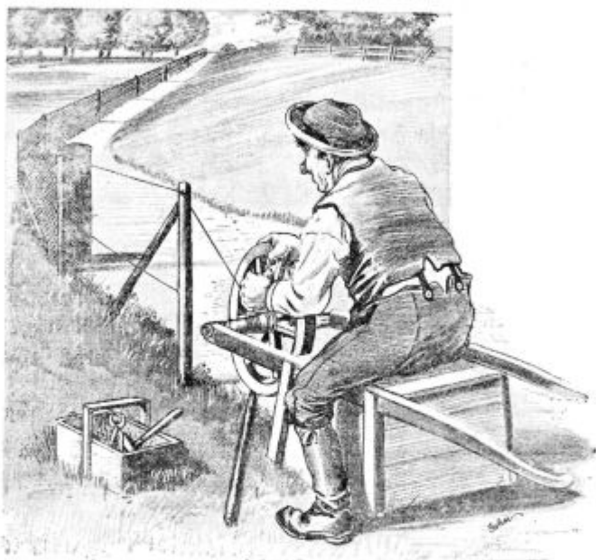
Pod. 25. Priprava nategača za žico.

žico je privezal na špico pri kolesu. Vsel se je nato sam na samokolnico, kolo parkrat obrnil in koj je bila žica, ki se je ovila okoli vretena, do skrajnosti napeta. Da ni potegnila žica samokolnice za seboj, zabodel je pred njo dva klina. Seveda bi se kolo na samokolnici samo odvrtelo, ko bi ne zabodel Peter med špice in pletišče količ, kateri se je naslonil na ročaja pri samokolnici.