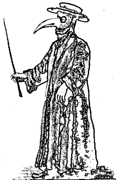
Obleka in maska zdravnikov in kirurgov v 17. stoletju za obrambo pred kugo. V nos so vlagali dišeča zelišča

miniaturist. Bogato je okrašena naslovna stran z besedilom v sredini in grbom cesarja Friderika III. 8