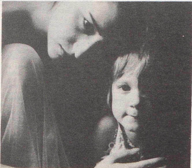
Življenje, stvaren in sanjski svet. Navidezno neskončen čas...

Velenjska okrogla miza sodi v okvir priprav na 17. kongres ICSID v slovenskih podjetjih, katerih skupno geslo je "Z oblikovanjem v višji cenovni razred."