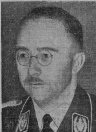
Himmler, poveljnik nemške policije, kateri vodi preiskavo o zagonetnem atentatu v Münchenu