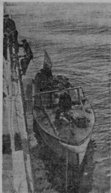
Nemci se podajo na zaustavljeni parnik v Severnem morju, da preišče njegov tovor