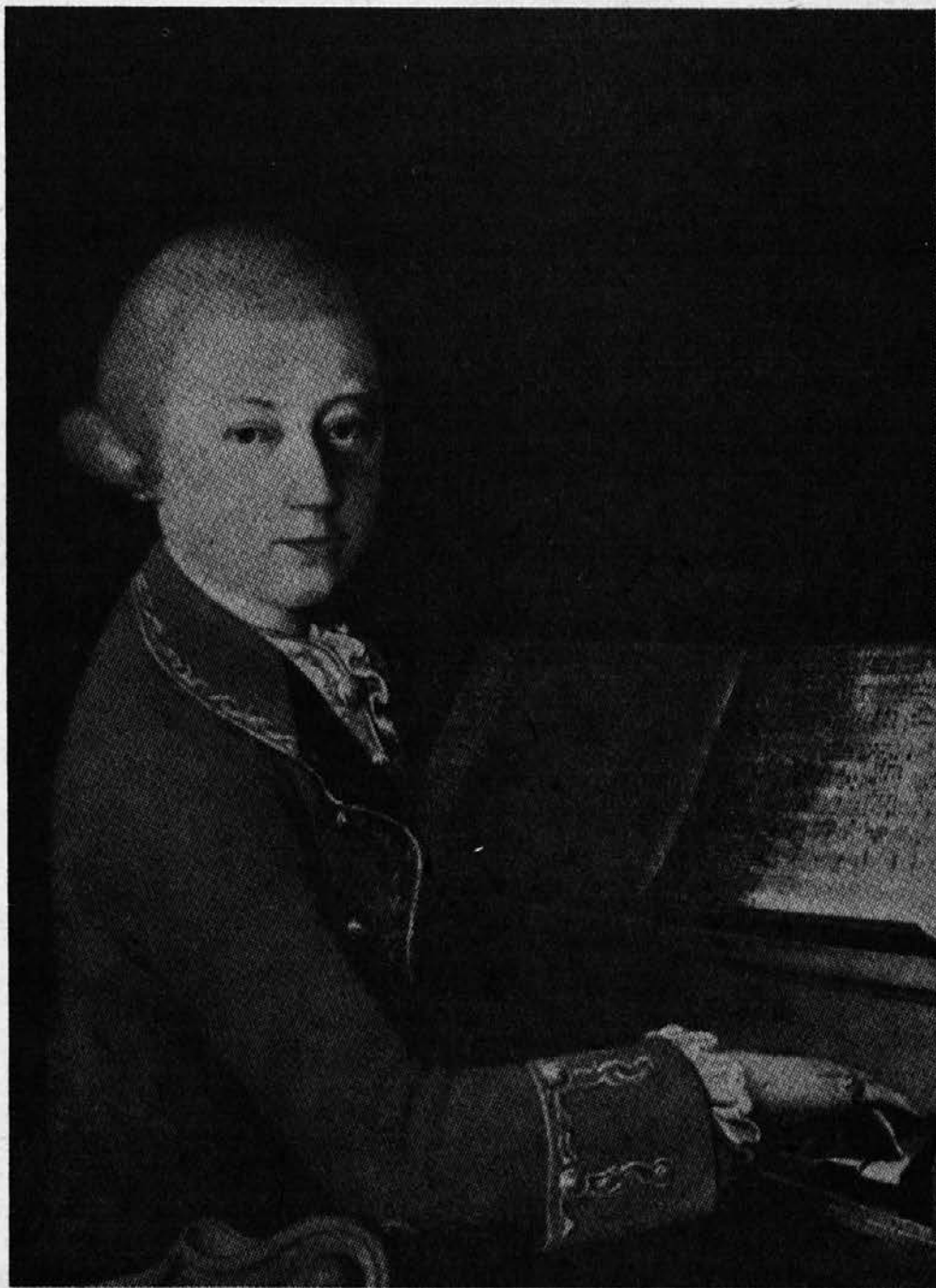
W. A. MOZART V LETU 1770