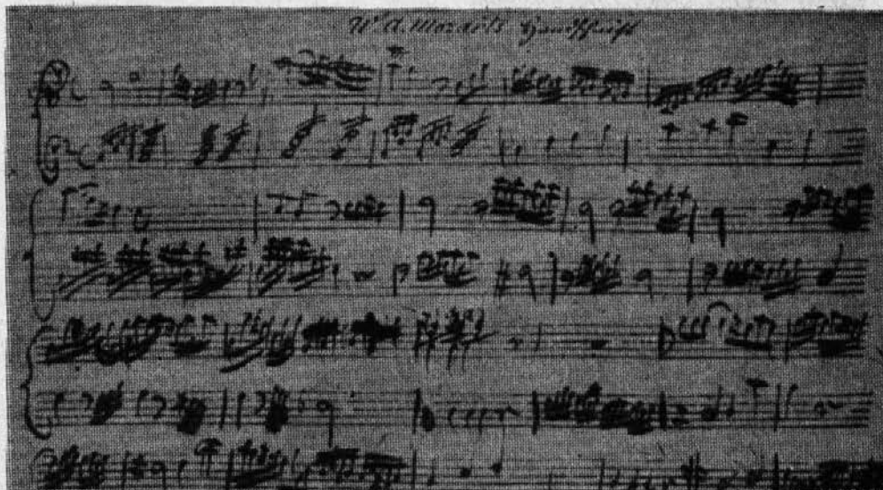
ENA PRVIH MOZARTOVIH KOMPOZICIJ V NJEGOVEM ROKOPISU