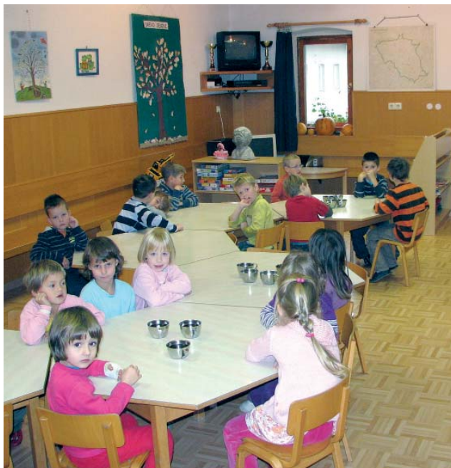
Dva oddelka vrtca sta v poljanskem lovskem domu.

Veliko število rojstev v občini v zadnjih letih (lani 122), in posledično veliko vlog za vpis otrok v predšolsko varstvo (153), so spodbudili pristojne k reševanju problema pomanjkanja prostora v vrtcih. Težavo so lani začasno rešili z odprtjem dveh oddelkov v Lovskem domu v Poljanah in enega v podružnični šoli Javorje. Da pa se tudi v prihodnje ne bi srečavali s podobnimi težavami, so poiskali nove lokacije, kjer bi lahko trajno uredili vrtčevske prostore. V Podružnični šoli Lučine so tako stanovanje preuredili v šolsko učilnico, šolarji pa so vrtcu odstopili eno svojih učilnic; oddelek lahko sprejme 19 malčkov. Poleg tega so začeli urejati še štiri igralnice v nekdanjem gostišču Mrzlk na Dolenji Dobravi, ki se je v primerjavi s prostori nad starim Merkurjem v Gorenji vasi izkazala za boljšo rešitev. Prve otroke bodo na tej lokaciji sprejeli predvidoma septembra 2010, s tem pa so, vsaj za zdaj, opustili možnost, da bi gorenjevaški vrtec Zala širil z gradnjo dodatnih igralnic ob OŠ Ivana Tavčarja.