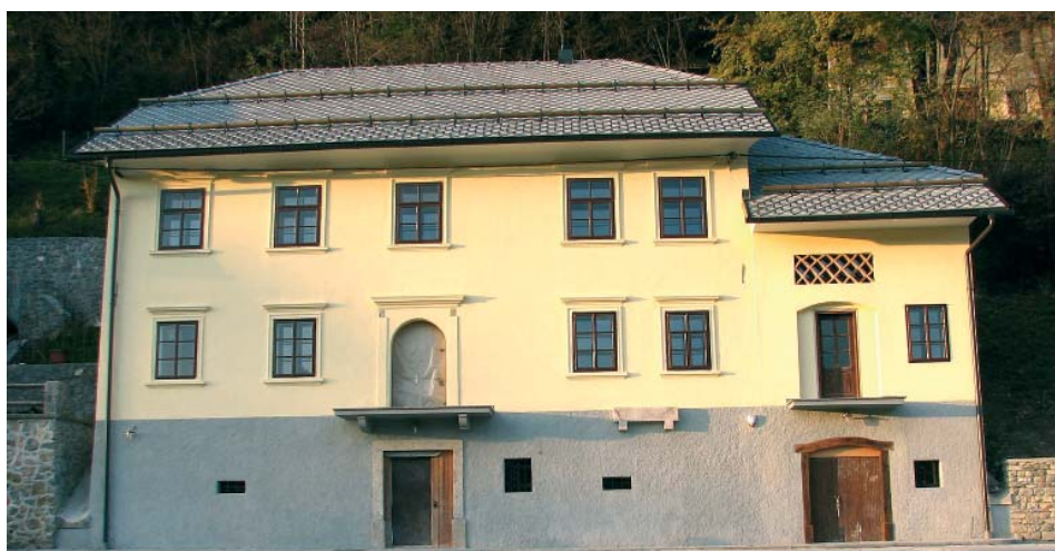
Prenovljena podoba zunanjščine Šubičeve hiše v Poljanah.

V Lučinah so po treh letih uspeli pridobiti uporabno dovoljenje za večnamenski dom, kar je za kraj velika pridobitev. Dom so sicer občanom slavnostno predali že leta 2006, vendar brez uporabnega dovoljenja, zato so ga krajanje uporabljali na lastno odgovornost, učenci pa so telovadbo še naprej izvajali v učilnicah in na hodnikih podružnične šole. Z zadostitvijo novim standardom požarne varnosti ter odpravo napak pri prezračevanju objekta so novembra 2009 pridobili potrebna dovoljenja za predajo objekta svojemu namenu. V domu so poleg