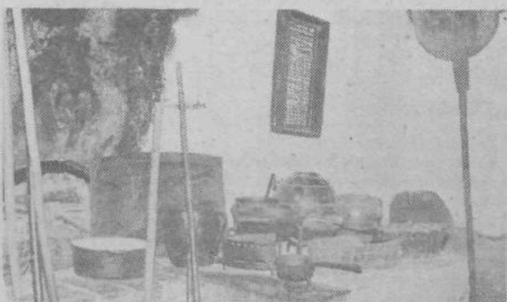
Rojstna hiša Josipa Jurčiča — notranjost