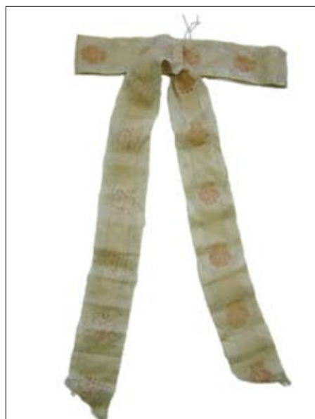
Avba razstavljena na štiri dele: naglavni brokatni del, lanene podloga, tilasta čipka in svilena pentlja

Pred razdiranjem avbe smo naredili temeljito fotodokumentacijo šivov ter nekaj skic in opisov, ki so nam bili pri ponovnem sestavljanju v veliko pomoč. V dokumentacijo smo dodali še fotografije zunanje in notranje strani, natančne mere, podatke o materialih in tehnikah izdelave ter opis stanja. Izdelali smo tudi risbe vzorca tkanine in kroj predmeta.