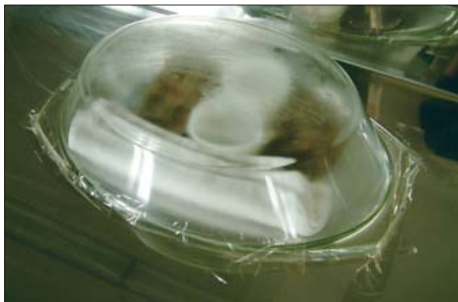
Improvizirana vlažilna komora

162 Pred ponovno namestitvijo v avbo smo ju še nekaj dni opazovali, da smo se prepričali, če ostaneta ravna tudi po odstranitvi uteži.