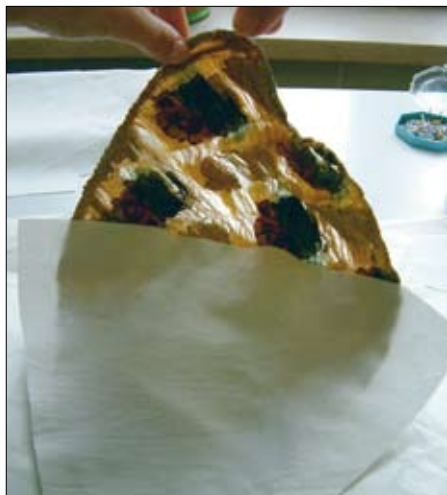
Podlaganje brokatnega dela z novo dodanim tekstilom