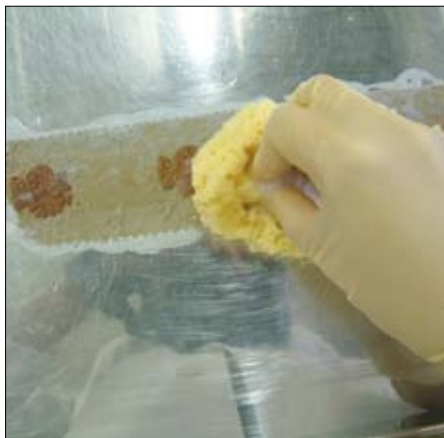
Pranje svilene pentlje

Sušili smo ju s hladnim fenom in nato še na zraku.