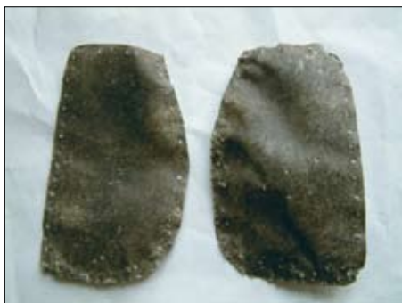
Hrbtni del kartonov pred ravnanjem