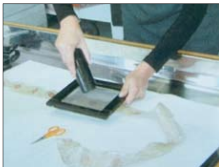
Sesanje pentlje skozi sintetično mrežico

Pred pranjem smo s površine tkanine najprej odstranili umazanijo, ki se še ni sprijela z vlakni. Za to smo uporabili sesalnik z nastavljivim zračnim vlekom (Ilec 2004:7). Da ne bi poškodovali površine ali celo posesali koščkov tkanine ali vlaken, smo sesali skozi sintetično mrežico. Mrežica je bila napeta na kovinski okvir, da smo jo lažje premikali po predmetu.