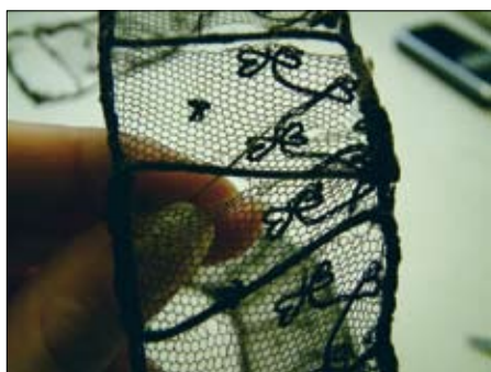
Šivanje tilaste čipke

Krojenje podporne tkanine je potekalo tako, da smo najprej prerisali kroj originalne podloge na papir, nato pa ga s papirja prenesli na material za podlaganje. Tega smo zaradi lažjega prilagajanja polkrožni avbi razdelili na polovico. Eno polovico bombaža smo z bucikami začasno pritrdili na notranjo stran avbe, seveda tam, kjer je bila avba najmanj poškodovana. Po tako nameščeni vmesni podlogi je bilo možno šivanje raztrganin – najprej manjših in nato večjih – s prednjim in vpetim vbodom. Ta dva vboda se tudi sicer v restavraciji največkrat uporabljata. Na vloženo bombažno podlogo smo najprej pritrdili razrahljane bombažne niti (z enim šivom največ po tri skupaj), šele nato so prišli na vrsto pozlačeni kovinski trakci.