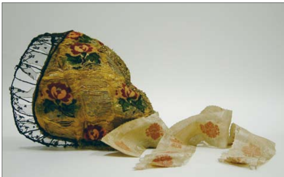
Avba pred konservatorsko-restavratorskimi posegi, SEM Ljubljana

Mikroskopske analize vlaken so pokazale, da sta pentlja in črni til svilena, brokatni del je iz nemerцерiziranega 3 bombaža in kovinskih (pozlačenih in posrebrenih) trakov, podloga pa je, kot piše že v inventarni knjigi, lanena.