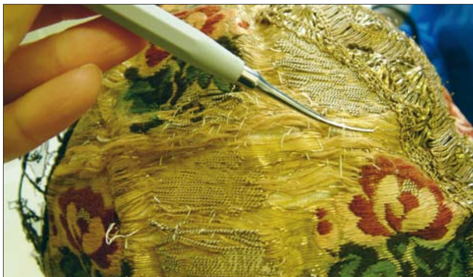
Stari popravki na avbi so preprečevali nadaljnje trganje, vendar so bili neestetski

Pri naši avbi ni bilo popolnoma jasno, ali so bili dokaj neestetski popravki na brokatnem delu delo restavratorja v preteklosti ali nekdanje uporabnice. Ker je avba pretežno zlata in lepo okrašena, je bila v času uporabe zelo verjetno bolj okras kot zaščita pred mrazom – zato smo se odločili, da ji povrnemo vso potrebno estetiko. Seveda pa smo popravke zelo natančno dokumentirali.