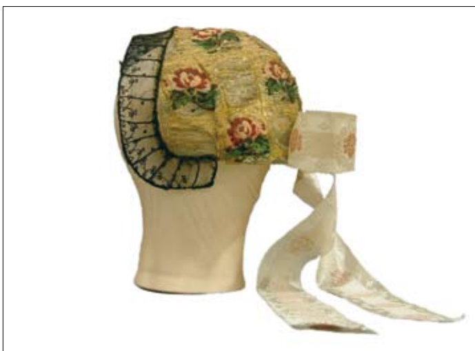
Restavrirana avba na zanjo narejenem podstavku