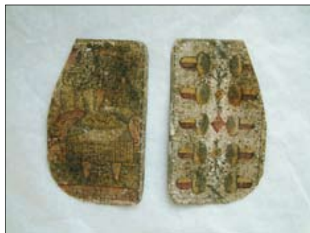
Lice kartonov po ravnanju