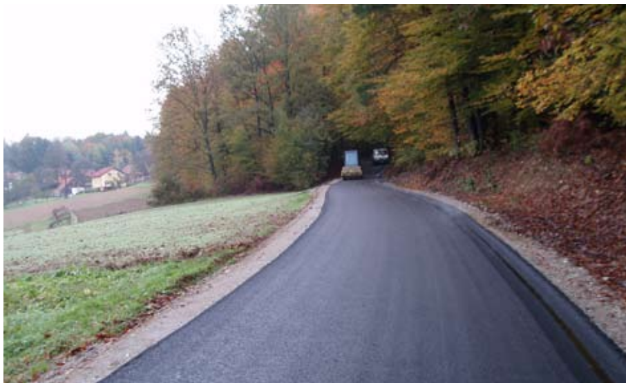
Cesta na Veseli grič