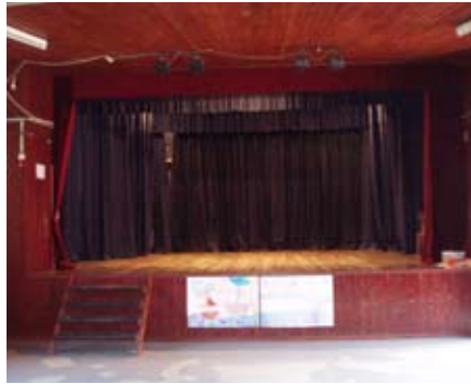
Prejšnja kulturna dvorana Vitomarci

Dvorana je višja in svetlejša, v njej so moderno urejene sanitarije in v kletnih prostorih kotlovnica. Za njo