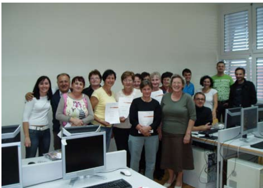
Udeleženci delavnic in mentorji prostovoljci

lokalna koordinatorka Simbioz@ v občini Sv. Andraž v Slov. goricah