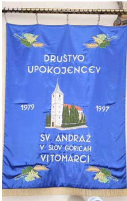
Društvo upokojencev Sv. Andraž v Slovenskih goricah

- Za ostale upokojence določiti socialni minimum v povezavi z življenjskimi stroški. Sedanji je neopravičljivo in neživljenjsko prenizek, posebno