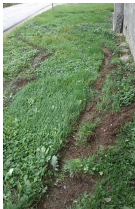
Zadnji zlet s ceste

Pozivam te voznike, da začnejo prilagajati hitrost vozila razmeram ob in na cestišču ter tako poskrbijo za varnost sebe in predvsem drugih. Želim si, da bi tukaj nekaj ukrenili