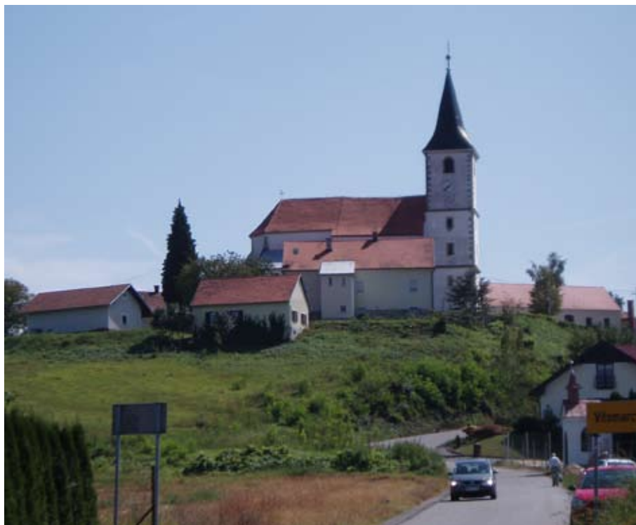
Pogled na gič s cerkvijo