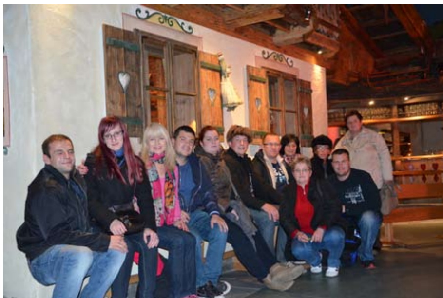
Vitomarški igralci s svojimi gostitelji