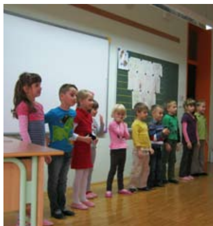
Sprejem otrok v 1. b