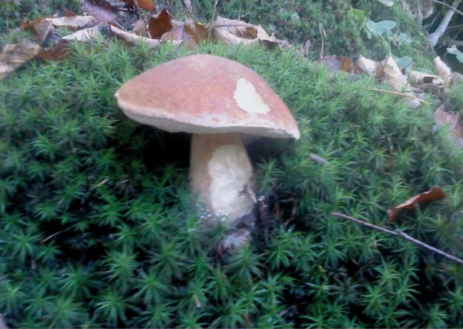
Jesen v gozdu