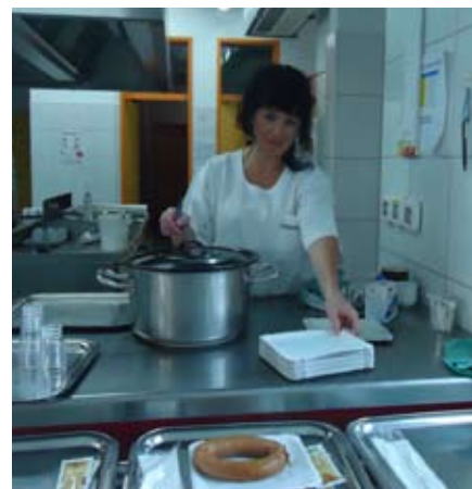
Priprava malic za krvodajalce

Številka 30 se sliši majhna, vendar pa je naša občina po prebivalstvu ena izmed najmanjših, prav tako je akcija potekala v času trgatav in nujnih jesenskih opravil, ki jih imajo naši kmetje, nekateri redni krvodajalci. V