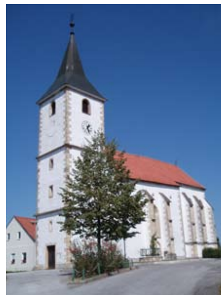
Cerkev Sv. Andraža