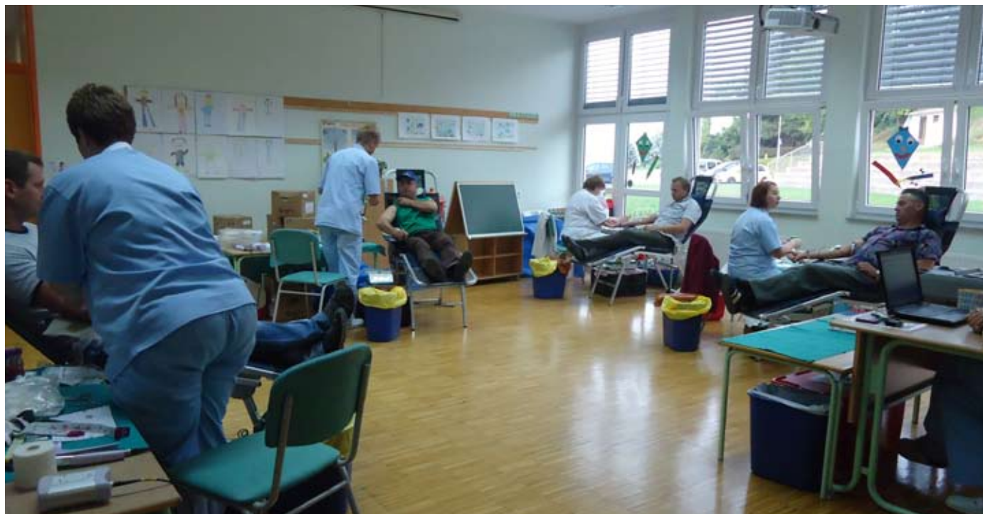
Nasmejani obrazi krvodajalcev in prijazno osebje UKC Maribor