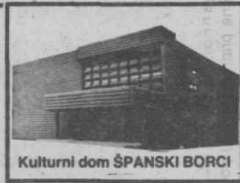
Kulturni dom ŠPANSKI BORCI

Oktet že dolgo poznamo, poje doma in v tujini, sodeluje na prireditvah in prosila