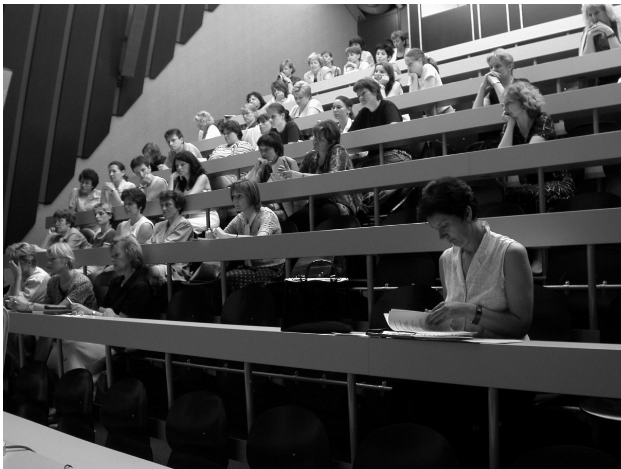
Slika 3 Zbrani na informativnem srečanju Sekcije za informatiko v zdravstveni negi – SIZ