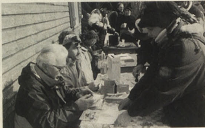
Na Bleščeči so udeležencem žigosali kontrolne kartice