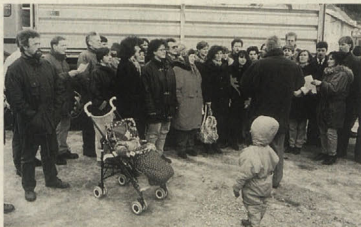
Ob polaganju je zapel tudi MePZ Podjuna

Dvorana kulturnega doma bo v izmeri 27x15x6 metrov ustrezala koroškim normam za športne dvorane. Na dveh kletnih nivojih bo ob dvorani razporejeni sanitarije, hišna tehni-