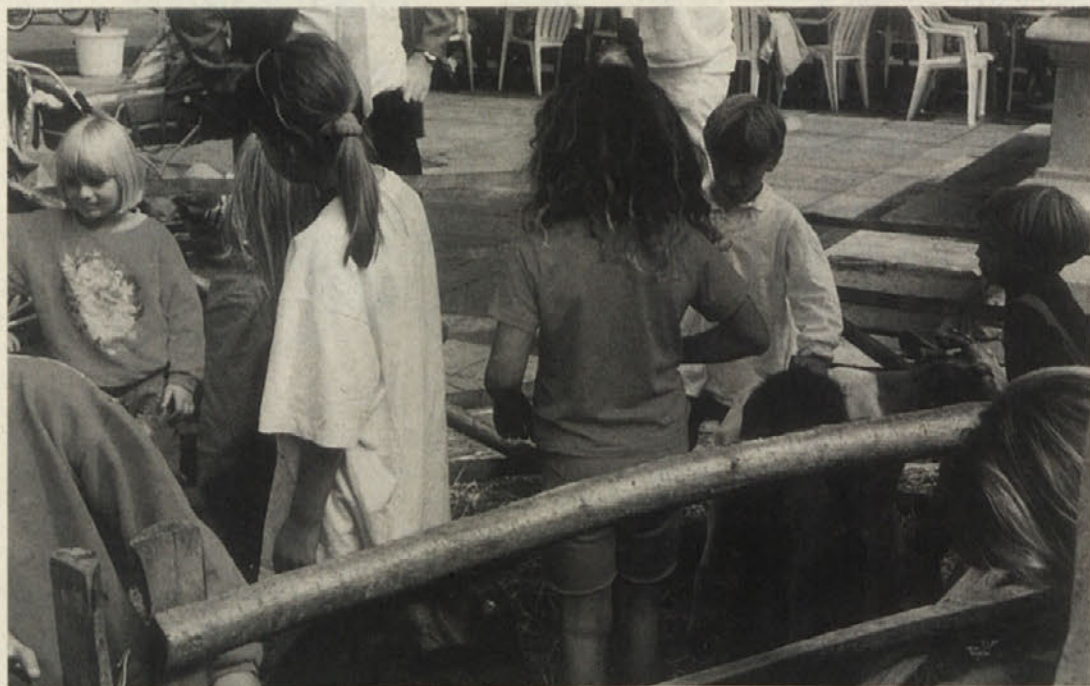
Razigrani otroci se na srečo še ne zavedajo posledic varčevalnih ukrepov