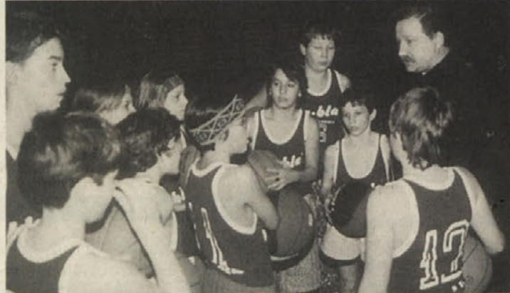
Kljub porazu pa najmlajši košarkarji SAK kvalitetno napredujejo

Dve koli pred koncem prvega ligaškega tekmovanja šolarjev