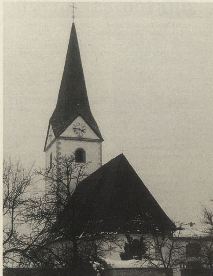
Cerkve so sestavni del naše podobe dežele

Koroška katoliška Cerkev je lansko finančno leto z 282,4 milijona šilingov zaključila izenačeno. Pri dohodkih je