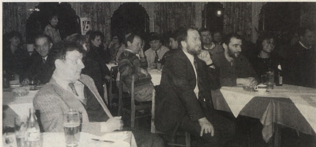
Pripadnost in zavzetost za delo v društvu se je izrazila tudi z množično udeležbo na občnem zboru