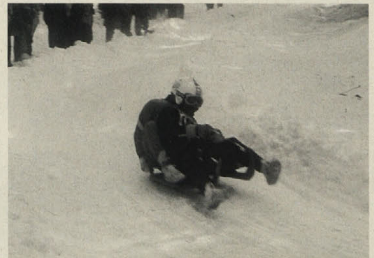
Na hitri in odlično pripravljene progi