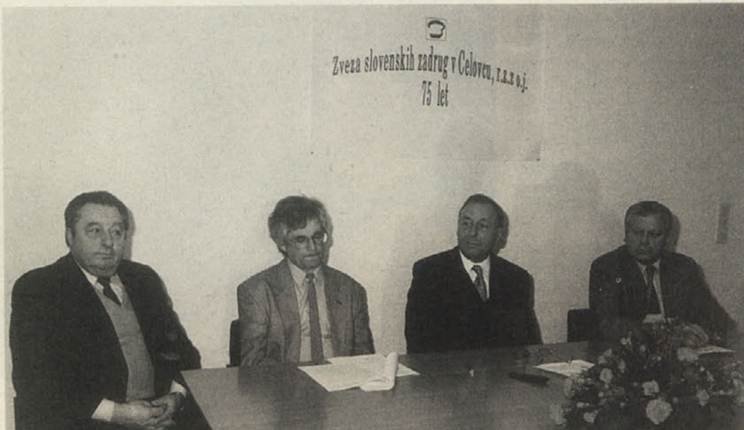
Predsedstvo slovesnosti Zveze slovenskih zadrug ob njeni 75-letnici