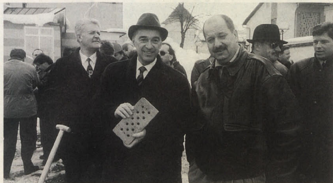
Ob polaganju temeljnega kamna za kulturni dom v Pliberku

Od zgodovinskega trenutka za slovensko srenjo v pliberški okolici do nadvse važne investicije za domače gospodarstvo se je raztezal lok pohval, ko so v soboto, 2. marca, v Pliberku polagali temeljni kamen za novo kulturno-športno središče, ali na kratko kulturni dom.