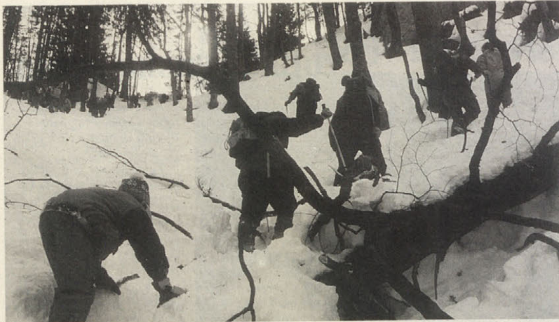
18. POHOD NA ARIHOVO PEČ