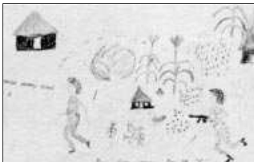
57 - Vojna v Sudanu