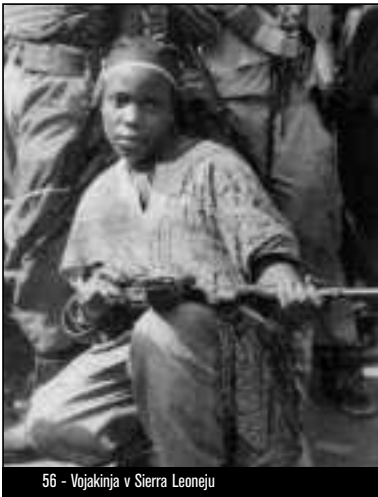
56 - Vojakinja v Sierra Leoneju

visoka, kot je bilo pred nedavnim, država podobno kot drugi proizvajalci nafte navidezno začne pridobivati. Po besedah Global Witness “dobiva dvakrat”: tako na račun povečane vrednosti izvoza nafte kot tudi zaradi razpoložljivosti novih posojil. 25 Vendar so dobitki le navidezni dobitki, kajti niti povečanje cene nafte niti količinsko povečanje proizvodnje v državljanski vojni ne krepí gospodarskega položaja Angole v svetovnem kapitalističnem sistemu. Za državo, ki je docela vključena v strukturo trgovanja disparatne menjave, so bile posledice vsakega povečanja količine črpanja nafte v zadnjih petindvajsetih letih le povečanje izgubljanja dragocene surovine, dodatni uvozi orožja in še večje gospodarsko nazadovanje in uničevanje človeških življenj.