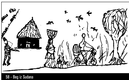
58 - Beg iz Sudana

jenih z vlado Angole. Po poročilih je ta družba leta 1992 opravljala naloge za zaščito več naftnih polj v Angoli v korist vlade v Luandi. In medtem ko je Executive Outcomes prej služila UNITA, je družba sredi devetdesetih let znova osvojila rudnike diamantov v Angoli, ki jih De Beers zdaj raje upravlja v varstvu zakonitega režima države Angola. 27