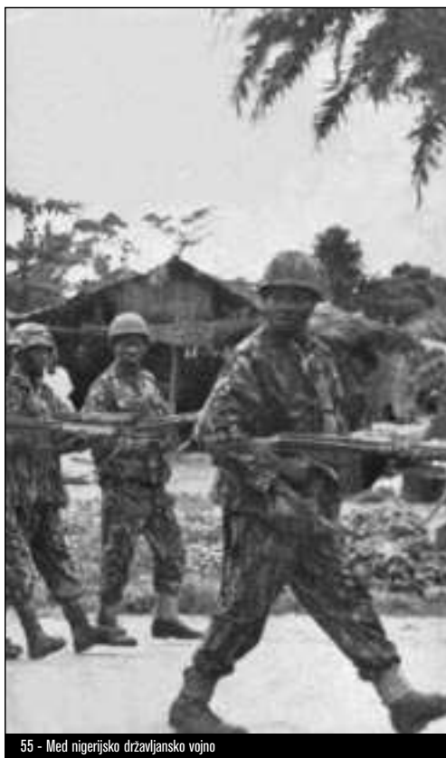
55 - Med nigerijsko državljansko vojno

Da bi razvili ekonomistično razumevanje vprašanja krvavih diamantov, je nujno, da si bližje ogledamo strukturo mednarodnega sektorja diamantov. Najbolj vpadljiva značilnost tega sektorja, kot se pogosto poudarja, je ta, da ga obvladuje ena sama transnacionalna, t.j. južnoafriška družba De Beers , ki ima velik vpliv na rudništvo in izkopavanje surovih diamantov po vsem svetu in že desetletja tesno nadzoruje trženje draguljev. V skladu s podrobnim poročilom o krvavih diamantih v Sierra Leoneju, ki je bilo objavljeno januarja 2000, De Beers iz lastnih rudnikov v Južni Afriki in iz rudnikov v partnerstvu z vladami v Botsvani, Namibiji in Tanzaniji izkoplje 50 odstotkov (po vrednosti) svetovne proizvodnje draguljev in diamantov. Poleg tega kupuje tudi diamante zunanjih trgov in jih prodaja prek organizacije za trženje Central Selling Organisation (CSO), ki je pod njenim nadzorom, 14 Čeprav ocene