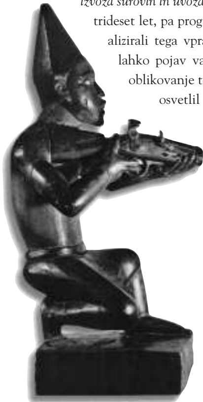
53 - Figura strelca iz zahodne Afrike

In vendar verjamem, da poročilo Svetovne banke ponuja smernice kritičnim ekonomistom in socialnim aktivistom. Collier se lahko izmuzne s svojo bedno analizo delno tudi zaradi odsotnosti tistih tendenc razmišljanj, ki bi sistematično razčlenile medsebojno povezanost izvoza surovin in uvoza orožja . Čeprav se metoda dispartatne menjave uporablja že vsaj trideset let, pa progresivni ekonomisti, kolikor mi je znano, niso nikoli konceptualizirali tega vprašanja, denimo v nasprotju z vprašanjem biopiratsva. 5 Zato lahko pojav varljivega poročila Svetovne banke velja kot opozorilo, da je oblikovanje teorije dispartatne menjave že zastarel dolg. V nadaljevanju bom osvetlil pomen te teorije za razumevanje sodobnih vojn v Afriki.