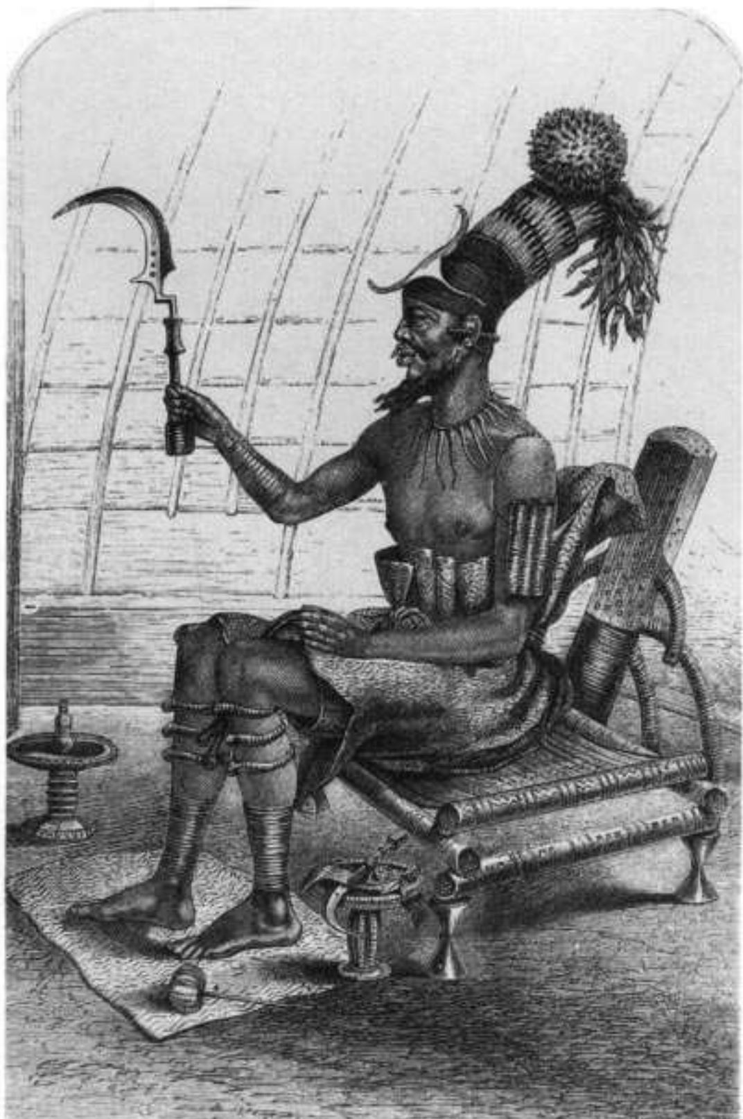
52 - Mangbetujski kralj Munza (1870)