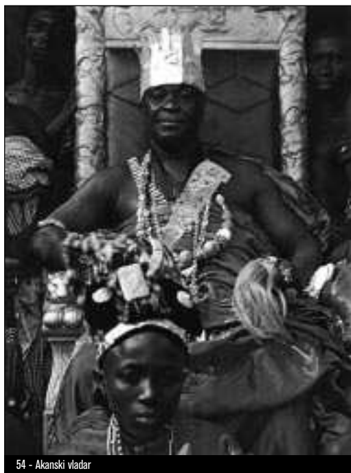
54 - Akanski vladar