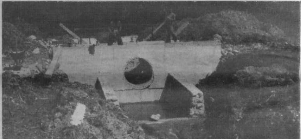
Druga, manjša zapora je na Penkačevem hudourniku, ki bo v kratkem urejen do izliva v Lisco, torej tudi pod cesto in mimo dolske graščine – v skupni dolžini okrog 500 m. Dela so bila zelo zahtevna, saj so morali odstraniti veliko nanešenega materiala.