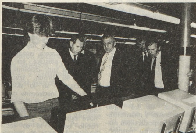
Visoki gost iz ČSSR si je z zanimanjem ogledal proizvodnjo Gorenja

Raziskave in razvoj Interna banka DSSS Gorenje SOZD DS Splošni posli DS Organizacija in informatika