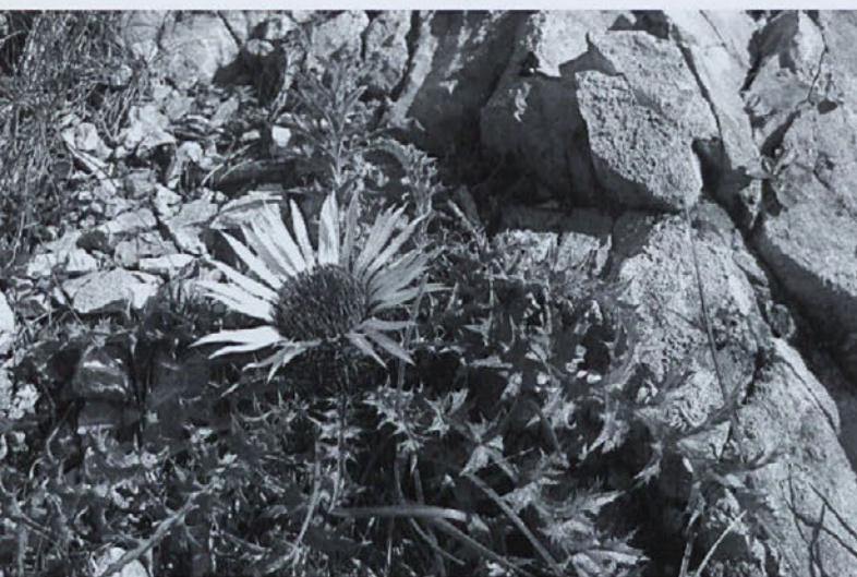
Bodeča neža tik pod slapom

Po vročih poletnih mesecih smo člani PD Žetale v mesecu septembru organizirali planinski izlet v eno najlepših ledeniških dolin v Sloveniji (žal je tudi ena od najbolj oddaljenih), Logarsko dolino.