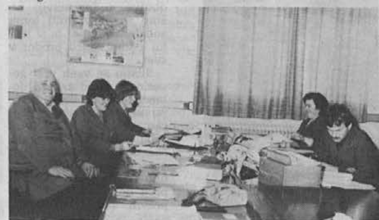
Iz planskega oddelka