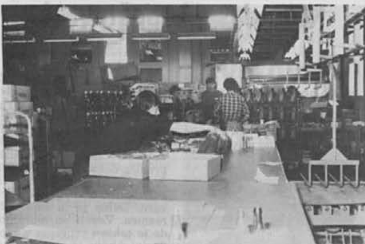
Iz montaže šal