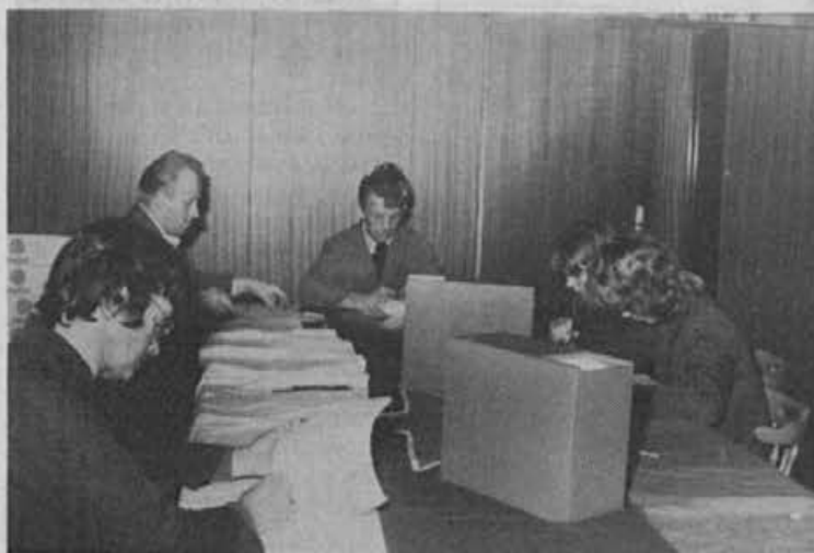
Od odločitve je odvisna kvaliteta dela samoupravnih organov