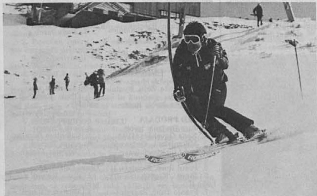
Vsem našim tekmovalcem želimo, da bi naleteli na čimmanj ovir