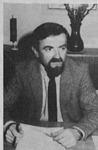
Poolimpijsko obdobje je naša priložnost