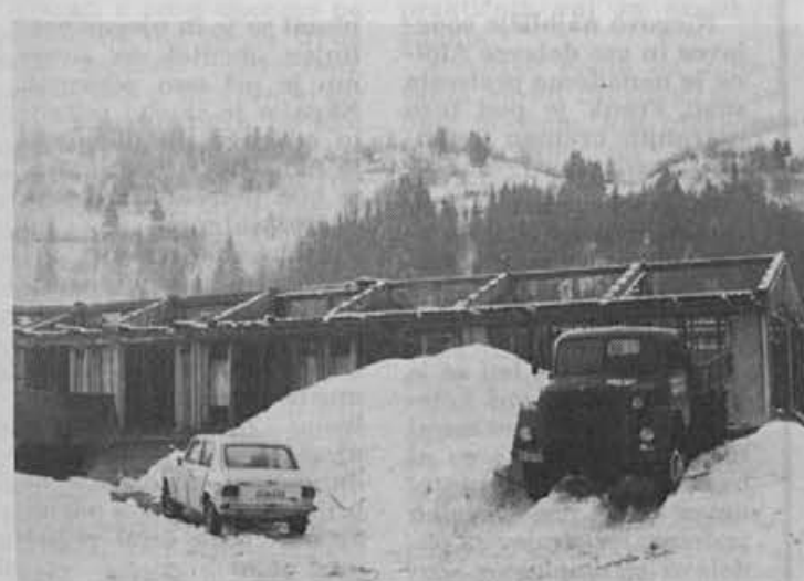
Gradnja skladišča vnetljivih snovi res počasi napreduje