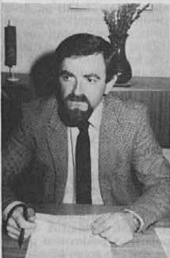
Sponzorska pogodba nam je že prinesla določene koristi