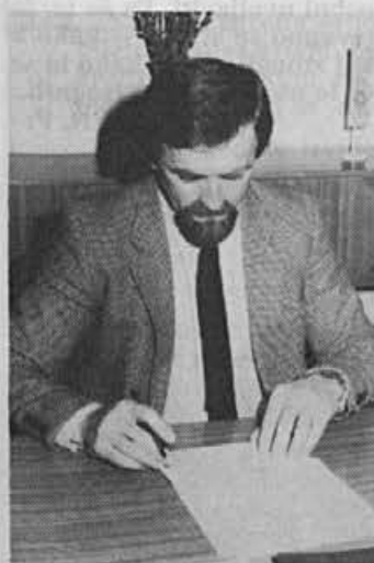
Tudi na olimpiadi bomo prisotni