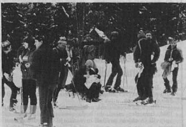
Tudi za rekreacijsko smučanje se je treba dobro pripraviti

Skratka, postal je zares naš dober prijatelj in sodelavec, ki je imel za vsakogar prijazno in hudo-mušno besedo. Pogrešali bomo njegovo znanje, njegov široki nasmeh in duhovitost, tovarštvo in prijateljstvo. V tem pogledu bo Frenk ostal vedno med nami.