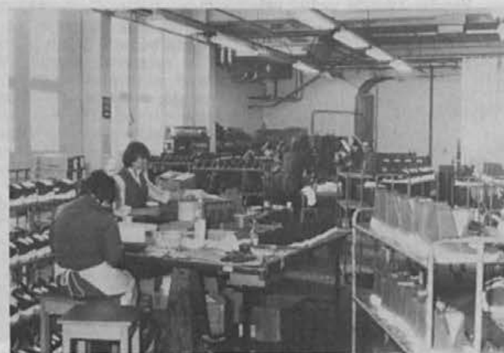
Iz oddelka za izdelavo apreski in druge športne obutve