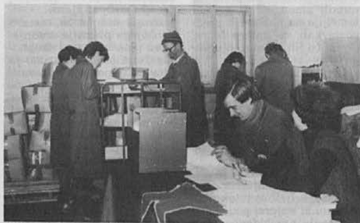
Kdo nas bo najbolje zastopal?