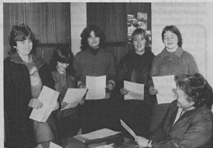
Izgleda, da so bili učni uspehi kar dobri