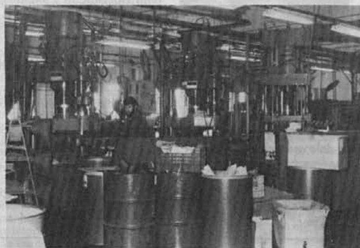
V tem oddelku so vlili že tisoče in tisoče sestavnih delov za smučarsko obutev

posebno za otroke pomembno, da so na smučanje telesno dobro pripravljene, da ne smučajo predolgo in da imajo čevlje, s katerimi lahko pravilno smučajo, pravilno smučanje pa se odraža ob gibanju »dol-gor« in ne »sede«, ali celo z iztegnjenimi nogami.