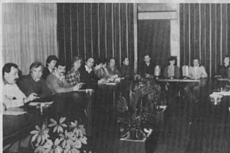
Na prvem zasedanju konference OO ZS Alpina je bila dobra udeležba in kvalitetna razprava