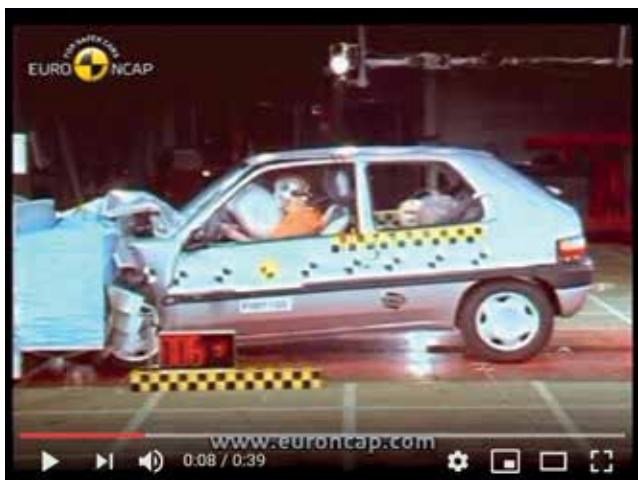
Slika 2: Posnetek varnostnega testiranja avtomobila Citroen Saxo leta 2000. [3]

Eksperimentalno nalogo je smiselno izvesti v 9. razredu pri blok uri fizike (če je to mogoče), po koncu obravnave sklopa Enakomerno pospešeno gibanje in 2. Newtonov zakon. Če blok ure nimamo na voljo, nalogo izvedemo v dveh zaporednih urah ali pa učenci del vaje naredijo doma. Eksperimentalno opremo za izvedbo imajo vse osnovne šole, štoparice pa imajo učenci na mobilnih telefonih.