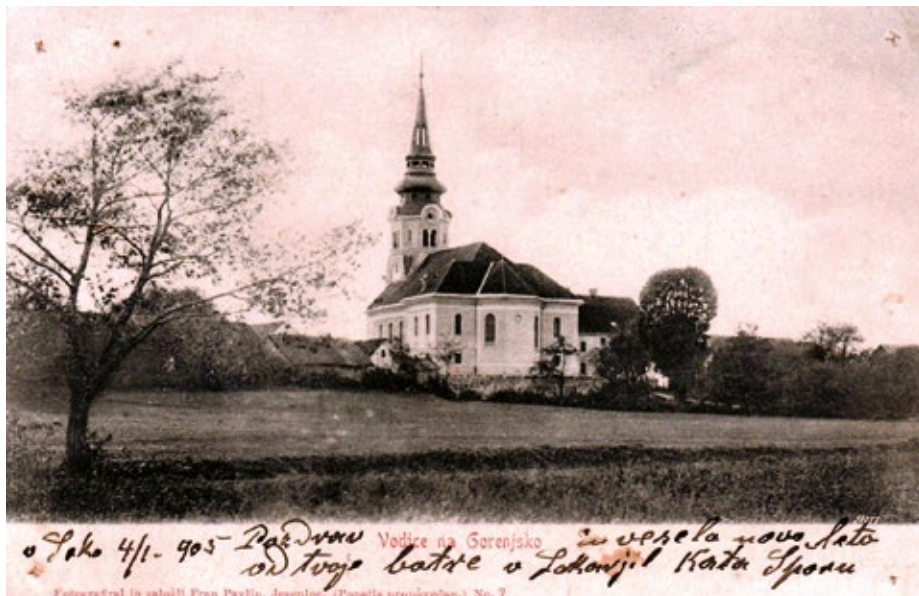
Vodice. Cerkev sv. Marjete

Že kmalu po prvi svetovni vojni je stoletja stara graščina Šinkov Turn