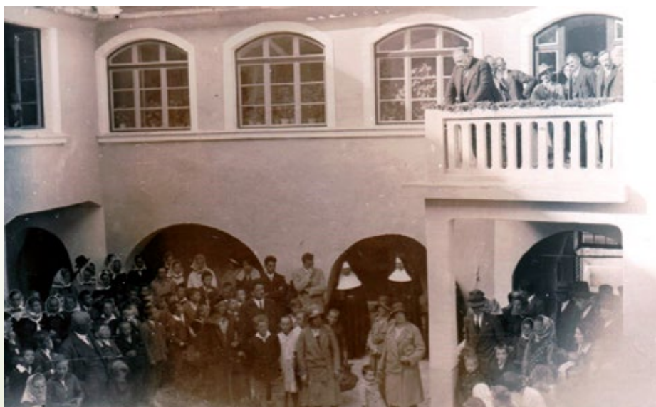
Državna osnovna šola Šenkov Turn