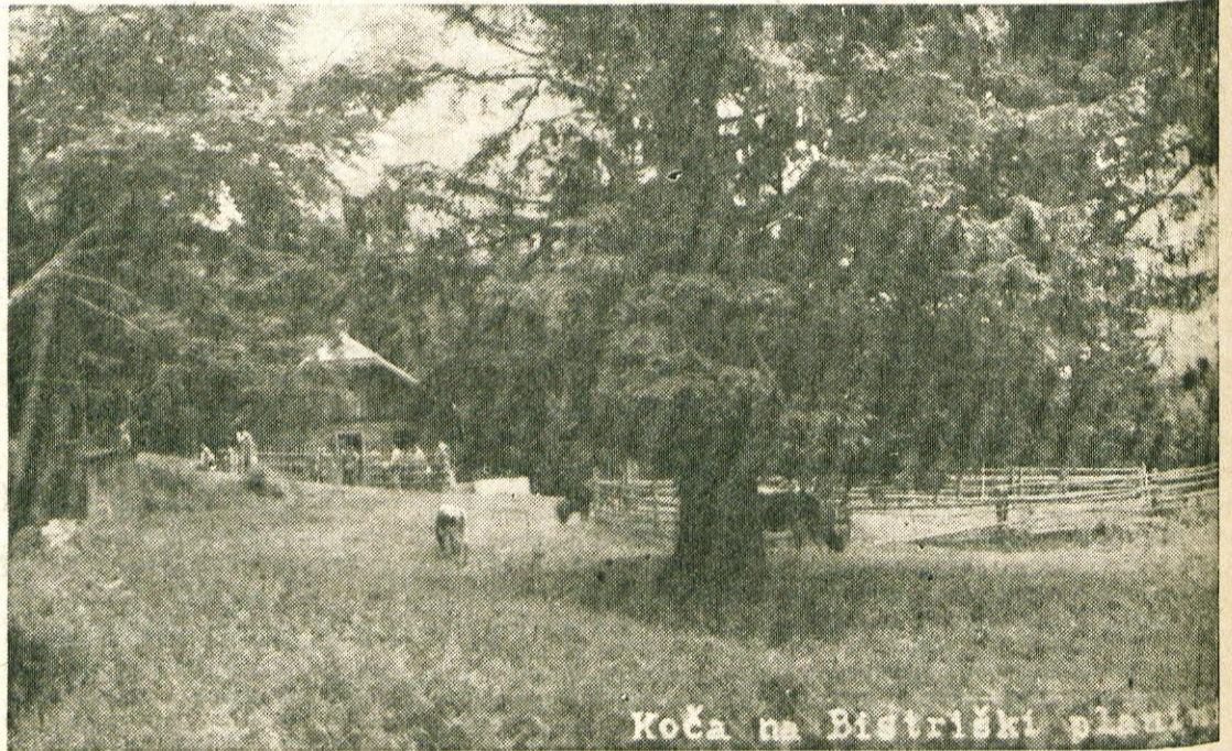
Koča na Bistriški planini

Planince so prostrana senožet v višini 820 do 900 m. Sredi trav stoje redke smreke, tu pa tam nekaj senikov. Senožet poživlja pisano cvetje: nokota, kukavice, encijan, gadovec. Na Planincih kosijo Bistričani le enkrat v letu, konec julija ali v začetku