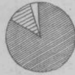
KMETIJSKO ZADRUŽNISTVO V 1954

le 355 manjših mlekarn, 218 sušilnic, 172 žganjarn, 55 hladilnic, 47 raznih delavnic za pre-