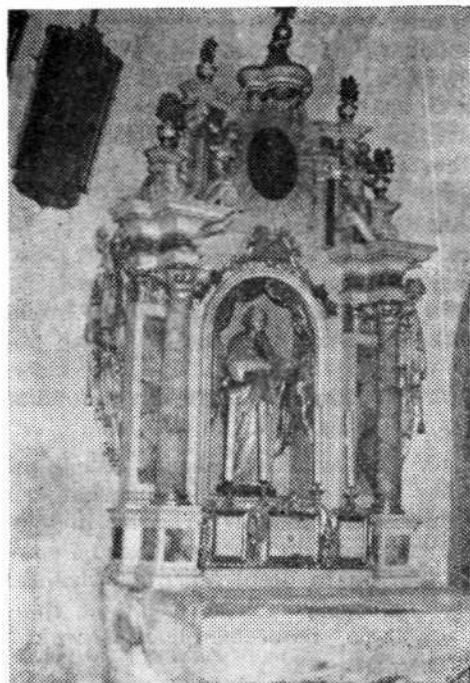
Levi stranski oltar v podružnični cerkvi v Pevnu