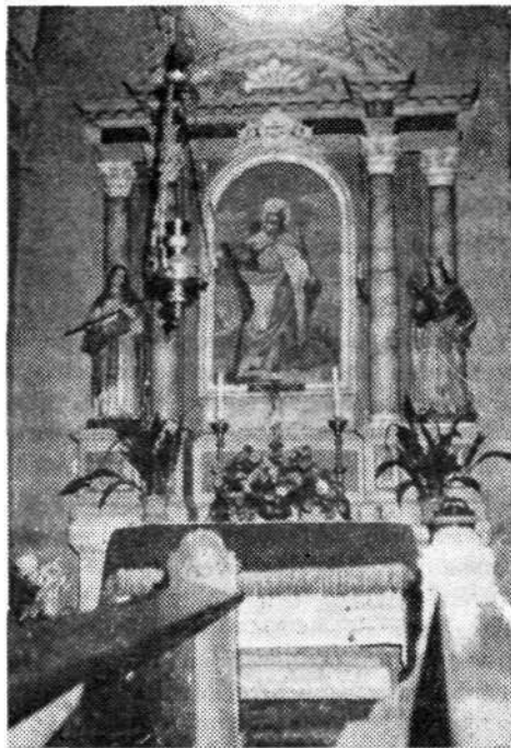
Desni stranski oltar v župni cerkvi v Zeleznikih