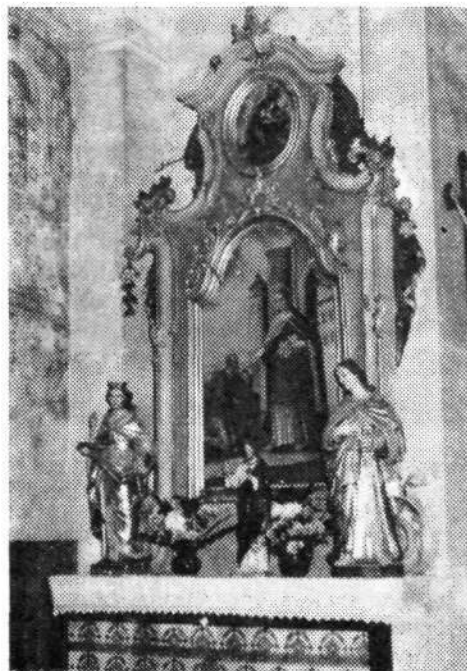
Levi stranski oltar sv. Elizabete v podružnični cerkvi na Bukovčici